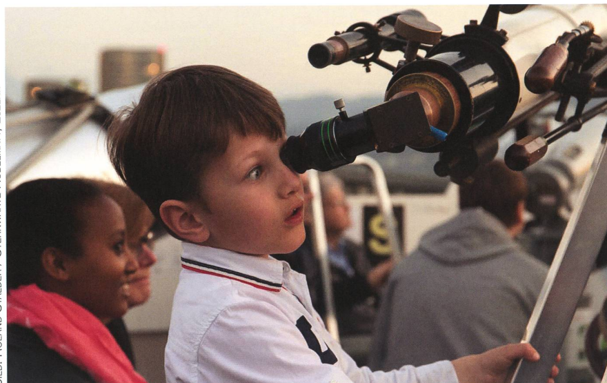
Abbildung 4: Dieser Junge hat den Merkur in der abendlichen Dämmerung erspäht.