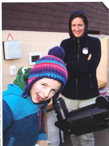
Abbildung 3: «So cool!»