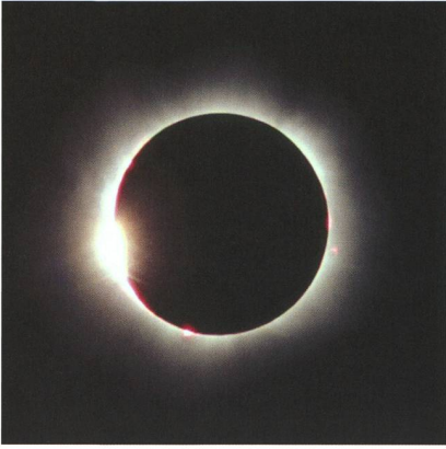
Abbildung 2: Totale Sonnenfinsternis 1999 über Ungarn. Soeben erlischt der letzte Sonnenstrahl um 12:46.9 Uhr MESZ am linken Mondrand. Die Korona taucht auf!