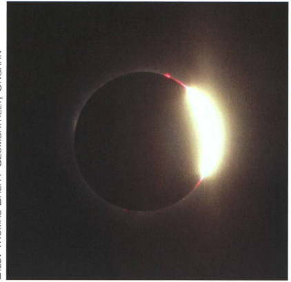
Abbildung 4: Der 3. Kontakt war um einiges imposanter als der zweite. Wie weissglühendes Metall quoll die Sonne um 12:49.1 Uhr MESZ wieder hinter dem Mondrand hervor.

rallinie stehen, denn keine 3 km vom Rand entfernt ist die «schwarze Sonne» schon während einer Minute zu sehen! Columbia und Jefferson City (Missouri) sind die beiden nächsten Stationen, über denen das Tagesgestirn erlischt. St. Louis am Mississippi liegt am Nordrand des Totalitätsstreifens und wird, ähnlich wie Kansas City, halbiert. Wer also Pech hat, sieht die Korona knapp nicht mehr, während man im südlichen Teil der Stadt das unvergessliche Schauspiel bis zu 2 min lang geniessen kann.