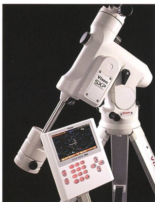
Parallaktische Montierung SXP mit Starbook TEN