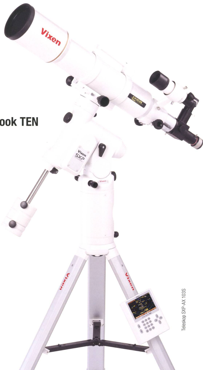
Teleskop SXP-AX 103S

VIXEN Fernrohr-Optiken: Achromatische Refraktoren – Apochromatische Refraktoren – Maksutov Cassegrain – Catadioptrische Systeme VISAC – Newton Reflektoren.