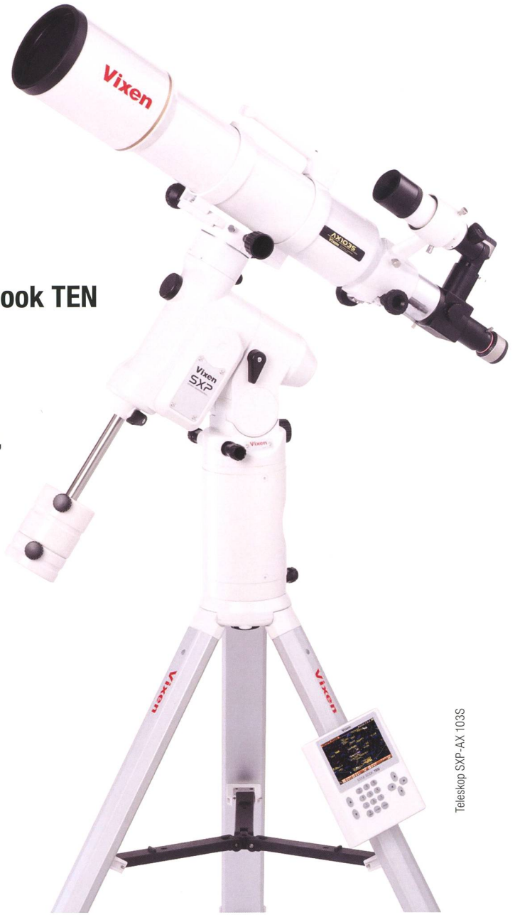
Teleskop SXP-AX 103S

VIXEN Fernrohr-Optiken: Achromatische Refraktoren – Apochromatische Refraktoren – Maksutov Cassegrain – Catadioptrische Systeme VISAC – Newton Reflektoren.