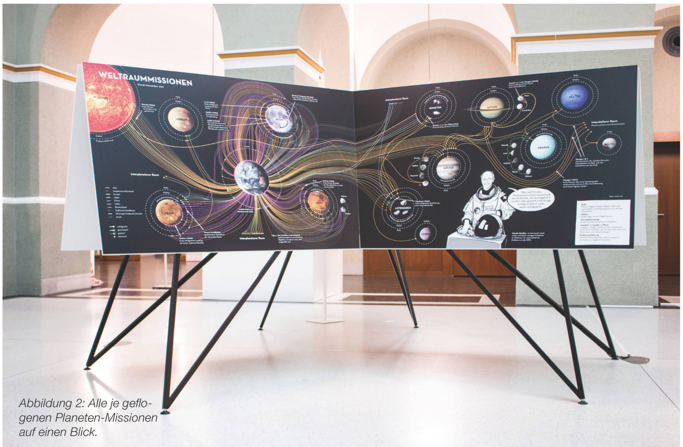
Abbildung 2: Alle je geflogenen Planeten-Missionen auf einen Blick.

ab April 2018, online Buchung www.focusterra.ethz.ch