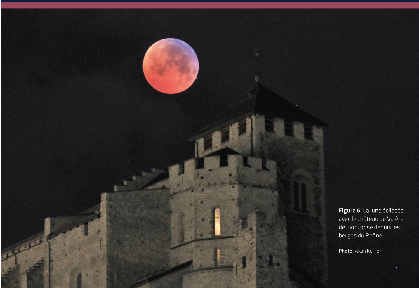
Figure 6: La lune éclipse avec le château de Valère de Sion, prise depuis les berges du Rhône.