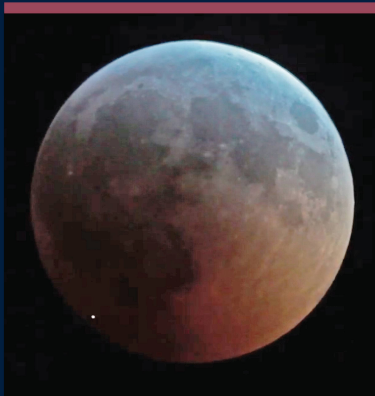
Abbildung 5: Deutlich ist der Lichtblitz auf diesem Screenshit zu sehen.