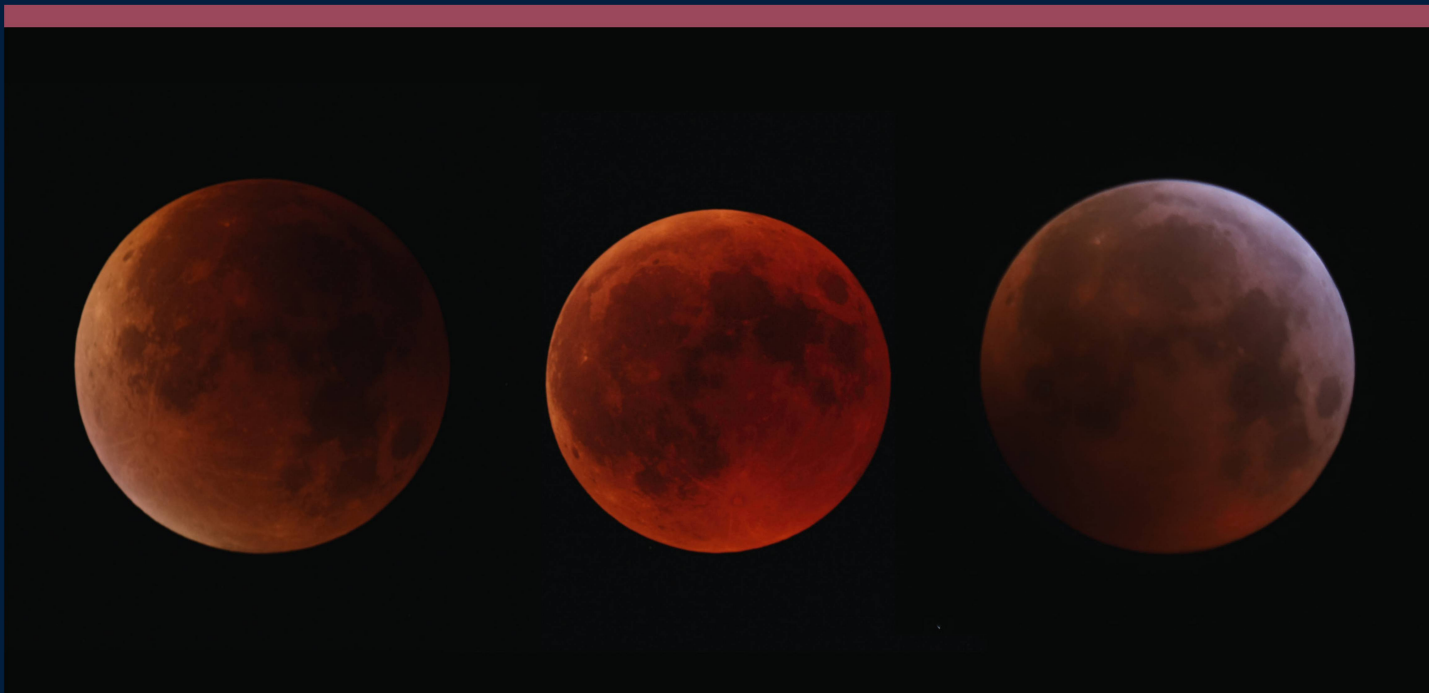
Abbildung 2: Die letzten drei bei uns sichtbaren totalen Mondfinsternisse im Vergleich. Die Aufnahmen entstanden immer zur Zeit des Finsternismaximums mit identischen Blendeneinstellungen und Belichtungszeiten. Damit ein objektiver Farbeindruck entsteht sowie der Dunkelgrad eingeschätzt werden kann, wurden die Bilder nicht bearbeitet. Links sehen wir die Finsternis vom 28. September 2015, in der Mitte jene vom 27. Juli 2018 und rechts die jüngste vom 21. Januar 2019.