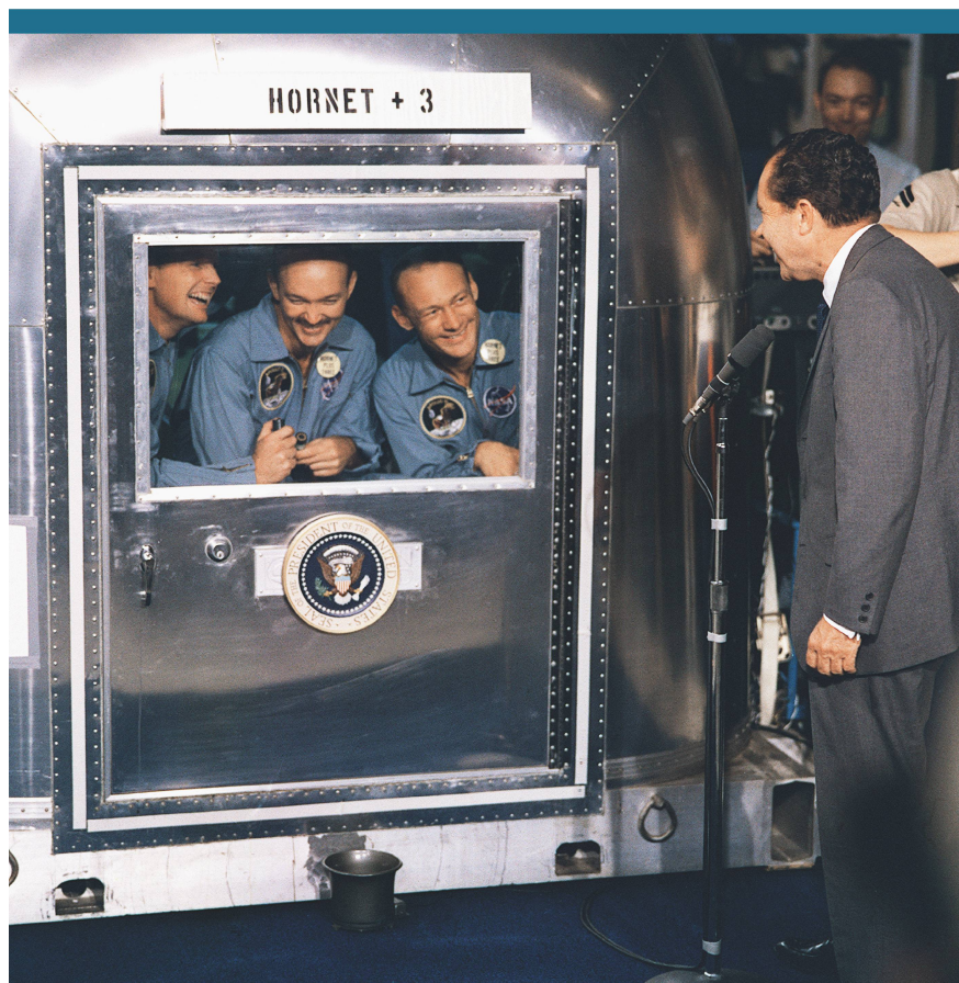
Abbildung 5: Der damalige US-Präsident Nixon besuchte die drei Helden während der Quarantäne.