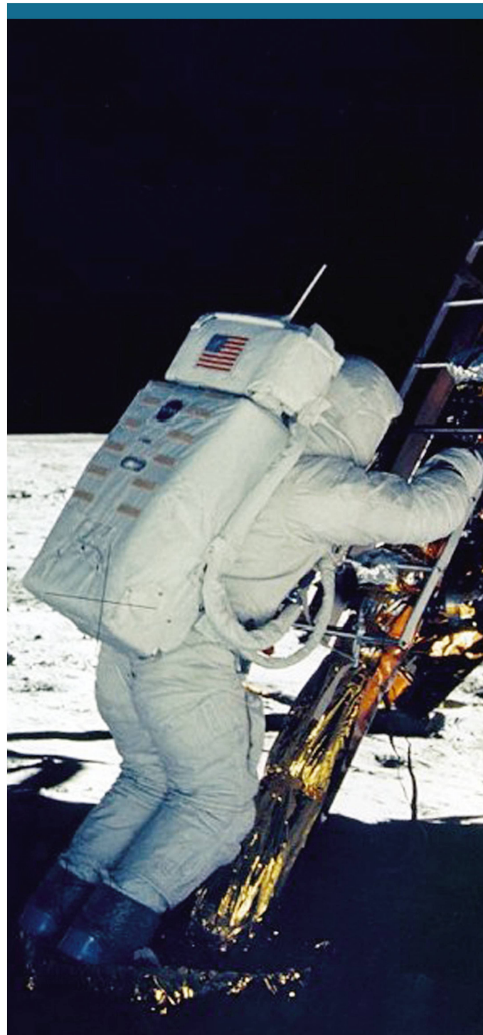
Abbildung 3: Buzz Aldrin verlässt die Mondlandefähre.

Neil Armstrong war in dieser Flugphase mehr als gefordert! Rund anderthalb Kilometer über Grund erklang abermals der Alarm des Navigationscomputers, da auch der Rendezvous-Radar ständig Daten lieferte. Der Autopilot liess den «Eagle» über ein weites Geröllfeld schweben. Schliesslich übernahm Armstrong die Handsteuerung und lotste den Adler sicher auf eine ebene Stelle rund 500 m westlich des «West-Kraters» und knapp 60 m jenseits vom «Little West»-Krater zu. In knapp einem Meter Höhe Bodendistanz zeigte eine Kontrolllampe das bevorstehende Aufsetzen an. Dann war es soweit: Am 20. Juli um 22:17:39 MESZ erfolgte der Bodenkontakt. Armstrong schaltete die Triebwerke aus. Die zusätzlichen Handmanöver hatten die Treibstoffreserven arg aufgebraucht. Den beiden Astronauten wären letztlich nur noch 20 Sekunden Entscheidungszeit geblieben, zu landen oder das ganze Manöver wörtlich in letzter Sekunde abzubrechen. Später stellte sich jedoch heraus, dass der im Tank verbliebene Treibstoff durch das Herumschwappen zu ungenauen Anzeigen führte und das Triebwerk noch etwas länger hätte versorgt werden können. Keine 20 Sekunden nach der Landung vermeldete Armstrong : «Houston, Tranquility Base here. The Eagle has landed!»