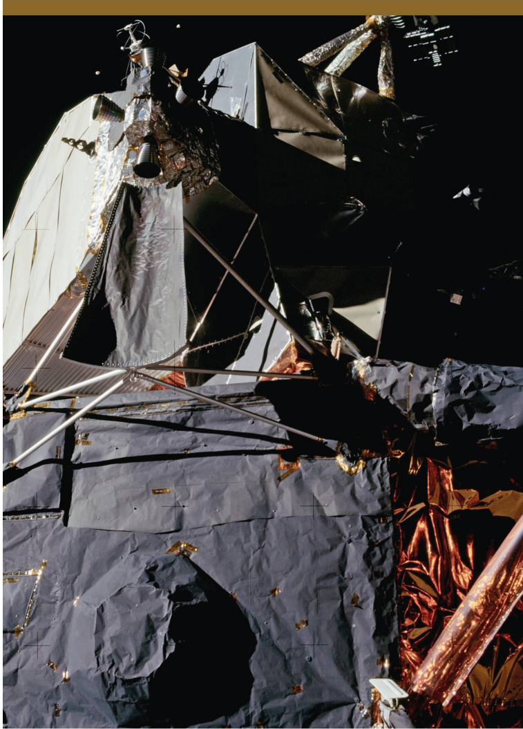
Abbildung 2: Keine Pappe, sondern der Hitze- und Mikrometeoritenschutz, der aus mehreren Schichten Mylar und Aluminium besteht. Aussen ist er mit schwarzer Pyromark-Farbe angestrichen, da Schwarz die Wärme besonders gut absorbiert. Dass es verknittert aussieht, ist Absicht: Damit werden die Kontaktstellen zur Fähre auf ein Minimum reduziert.