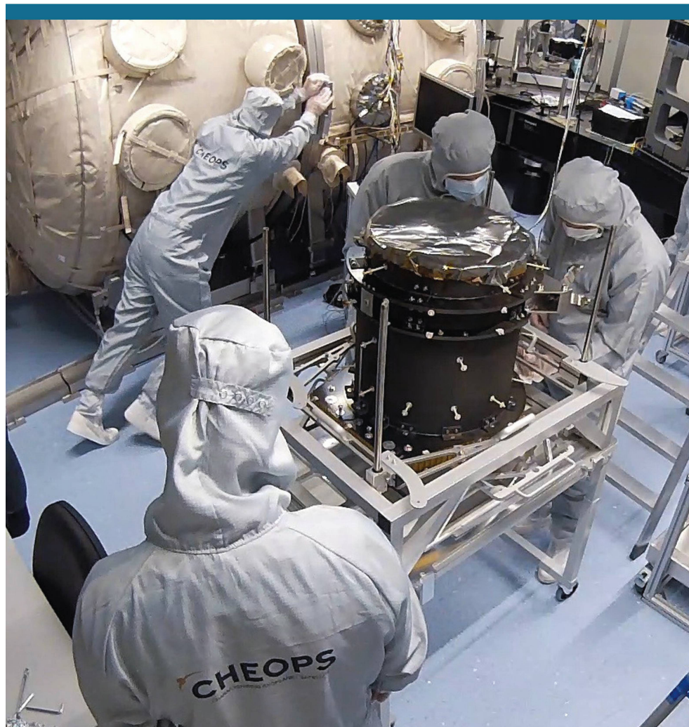
Abbildung 1: Das CHEOPS-Team baut im Reinraum an der Uni Bern das Flugmodell zusammen.