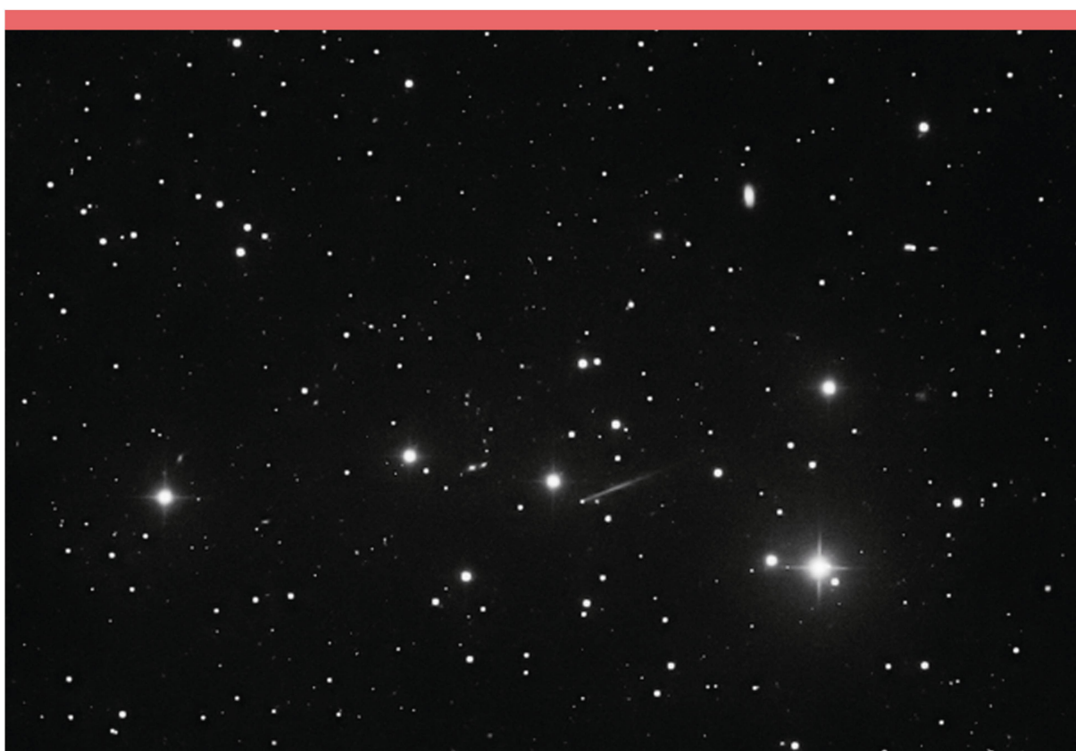
Abbildung 1: Diese Aufnahme von (6478) Gault wurde am 9. Januar 2019 mit dem 1 m-Schmidt-Teleskop der Optical Ground Station OGS der ESA auf Teneriffa (J04) aufgenommen. Es sind drei gestackte Einzelframes mit je 90 Sekunden Belichtungszeit.

Dass es auch bei längst bekannten Hauptgürtel-Asteroiden immer wieder zu Überraschungen kommen kann, wurde am 8. Januar 2019 durch eine ungewöhnliche Entdeckung manifestiert. Der US-amerikanische Survey ATLAS, der zur «Zwicky Transient Facility (ZTF)» gehört, meldete damals eine Aktivität des bisher ganz gewöhnlichen, schon seit vielen Jahren bekannten und völlig unauffälligen Asteroiden (6478) Gault.