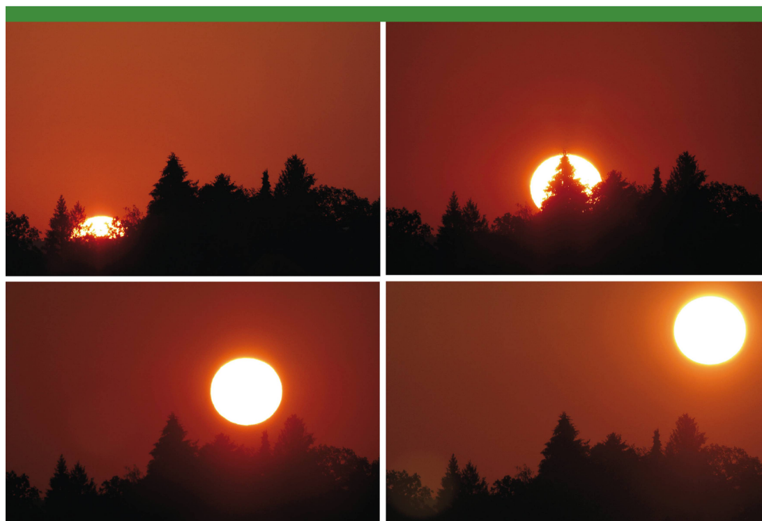
Abbildung 1: Sonnenaufgang in Schwarzenburg am 4. August 2018, erste Foto um 6:24 Uhr. Gezeigt ist nur jede zweite Aufnahme aus der Serie, die für das Rätsel verwendet wurde. Die zeitlichen Abstände von Bild zu Bild betragen hier 3 Minuten (womit die Lösung bereits verraten wäre).

Abbildung 3 zeigt blau die scheinbaren Sonnenorte und rot die um die Refraktion verbesser-