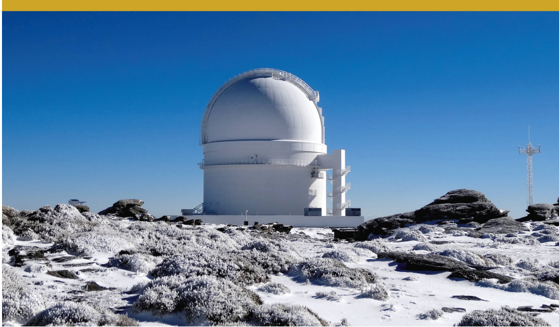
Abbildung 3: Der Exoplanet GJ 3512b wurde vom CARMENES Konsortium entdeckt mit einem Teleskop am Calar Alto Observatorium in Südspanien.