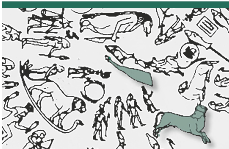
Abbildung 4: Darstellung von Stier und Stierschenkel auf dem runden Tierkreis von Dendera in Oberägypten (Zeichnung).

Im Jahr 1054 registrierten chinesische Astronomen im östlichen Bereich des Stierbilds eine Supernova; ihre Überreste sind im Krebs- oder Krabbennebel zu finden, den