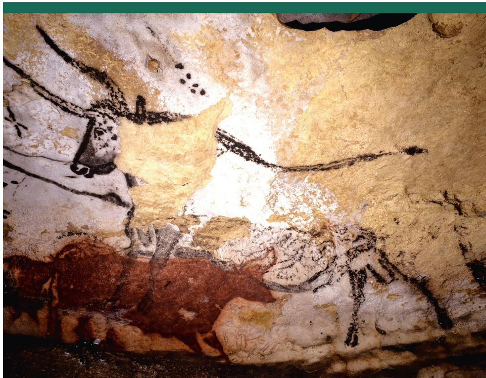
Abbildung 2: Darstellung des «4. Stiers» in der Höhle von Lascaux; er ist beinahe 6 m lang. Die sechs Punkte oberhalb der Stierschulter sind gemäss Michael Rappenglück die Plejadensterne.