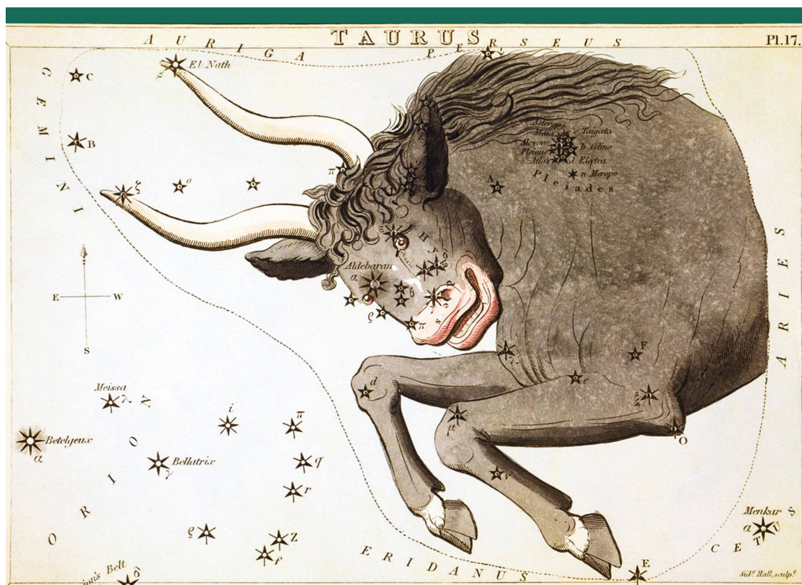
Abbildung 1: Sternbild Stier aus «Urania's Mirror» (1825) von Sidney Hall (1788 – 1831). Die Sammlungsbox enthielt 32 Sternbild-Karten. Sie waren bei den Sternen gelocht, sodass man sie vor eine Lichtquelle halten und das Sternen-Bild sehen konnte.

Die 1940 entdeckte Höhle von Lascaux in Südwest-Frankreich weist wundervolle jungsteinzeitliche Höhlenmalereien mit Tierdarstellungen auf. Heute zählt diese «Sixti-