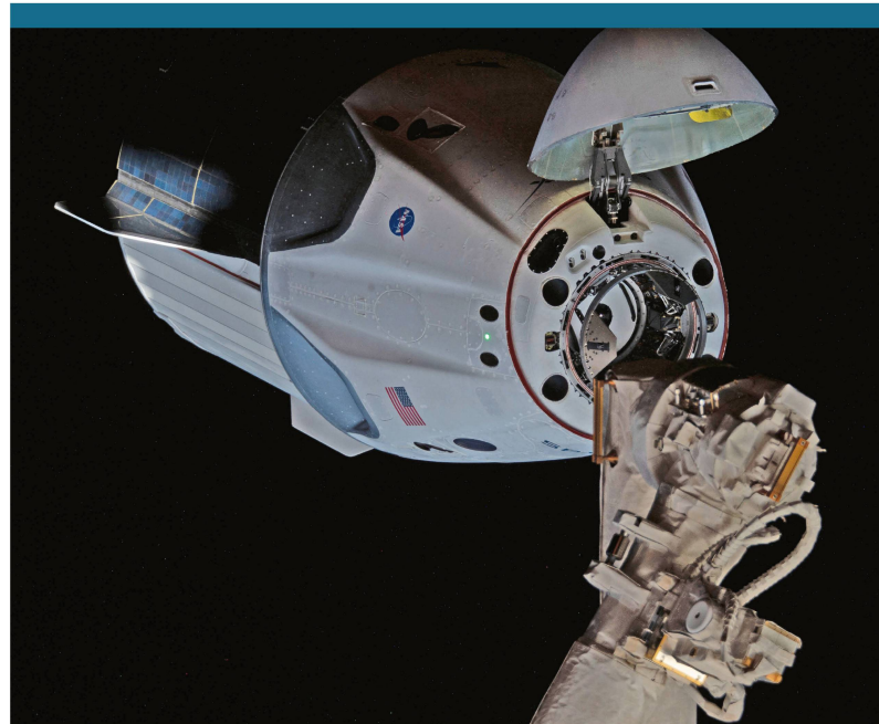
Abbildung 1: Die Astronauten Doug Hurley und Bob Behnken vom Commercial Crew Program der NASA befanden sich an Bord der SpaceX Crew Dragon, als sie sich der Internationalen Raumstation näherten. Der Nasenkegel des Crew Dragon ist offen und zeigt den Andockmechanismus des Raumfahrzeugs, der mit dem vorderen internationalen Docking-Adapter des Harmony-Moduls verbunden wird.

gerne für utopisch gehalten und belächelt wurden. Doch was Musk in den 18 Jahren schaffte, sucht Seinesgleichen, nicht zuletzt mit den wiederverwendbaren Raketentufen, die nicht an Fallschirmen baumelnd in den Fluten des Atlantiks wassern, sondern mit dem Resttreibstoff mittlerweile so sichere Punktlandungen an Land