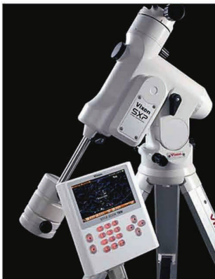
Parallaktische Montierung SXP mit Starbook TEN