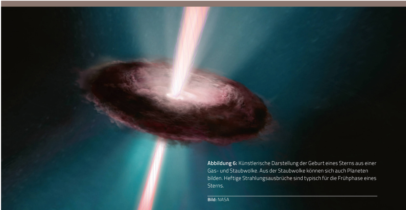
Abbildung 6: Künstlerische Darstellung der Geburt eines Sterns aus einer Gas- und Staubwolke. Aus der Staubwolke können sich auch Planeten bilden. Heftige Strahlungsausbrüche sind typisch für die Frühphase eines Sterns.