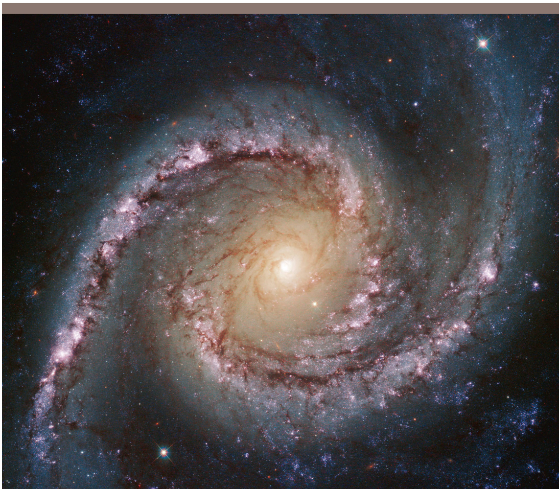
Abbildung 4: NGC 1566, eine wunderschöne Spiralgalaxie im südlichen Sternbild Schwertfisch. Auch in ihr bewegen sich die Sterne schneller, als es die Masse der Galaxie zuliesse.

Was ist damit gemeint? Wenn ich mit meinen Fingern auf die Computertastatur tippe, so drückt dies