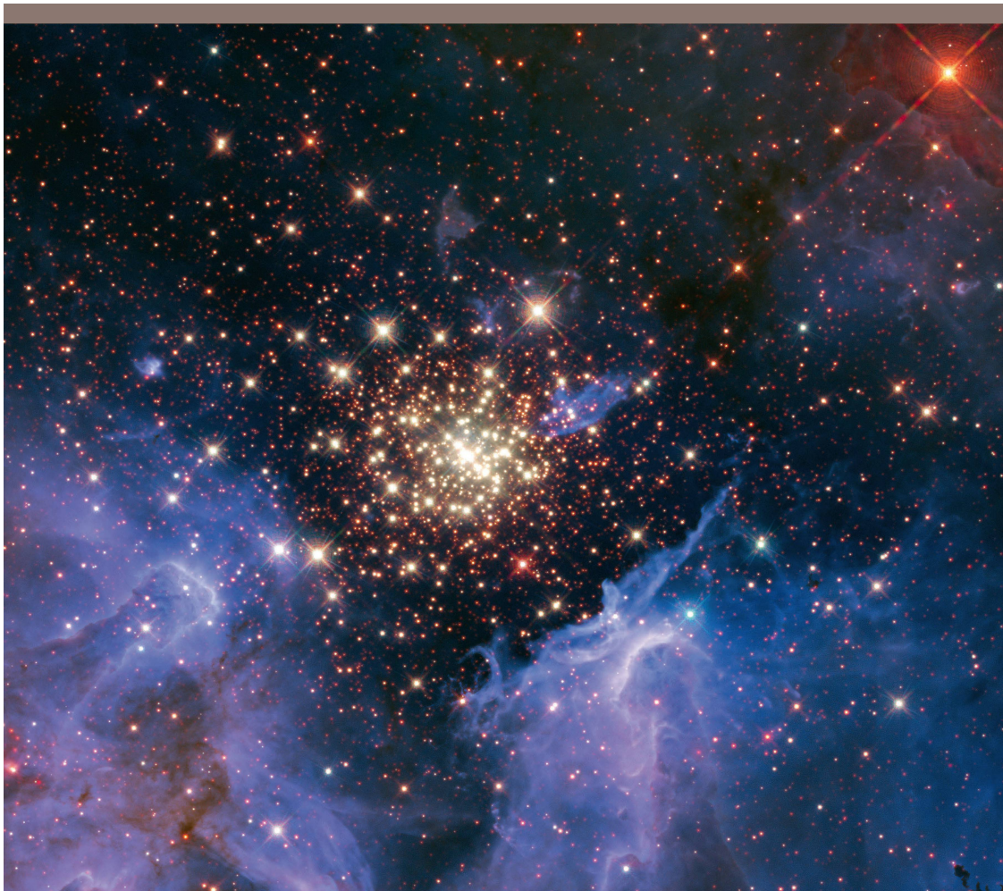
Abbildung 5: Hubble Aufnahme von NGC 3603, einer Region in unserer Milchstrasse, in welcher sich aus Gas- und Staubwolken eine grosse Zahl junger Sterne gebildet hat. Die Sterne im zentralen Haufen haben mit ihrer Strahlung ein enormes Loch in die Gaswolken gebrannt.

Aber auch die Dunkle Materie könnte durch eine heute noch nicht nachgewiesene Kraft erklärt werden.