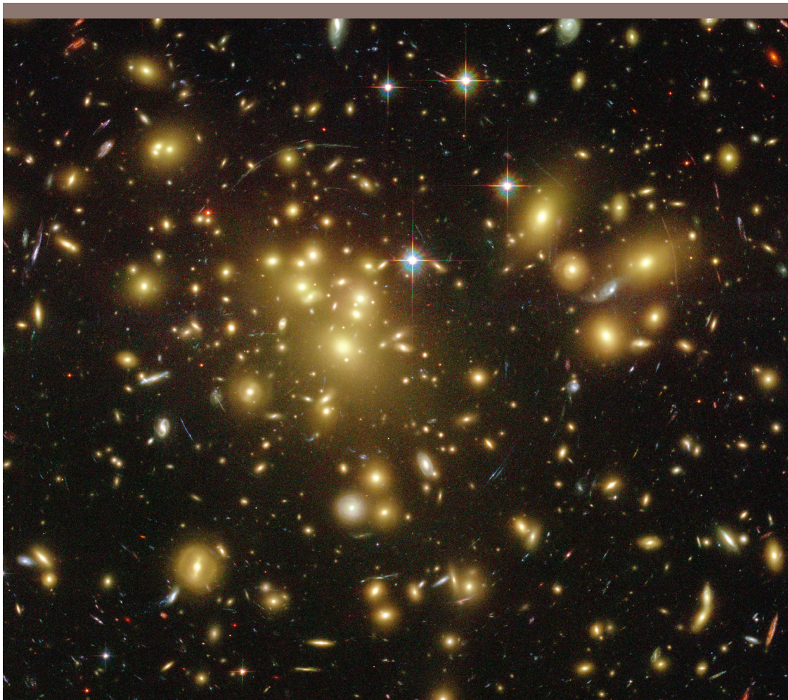
Abbildung 3: Galaxien im Coma-Haufen. Die Objekte mit einem «Strahlenkreuz» sind Vordergrundsterne aus unserer Milchstrasse. Alle anderen auch noch so kleinen Flecken sind Galaxien. Die Masse des Haufens ist so gross, dass das Bild einiger Galaxien wie durch eine Linse verzogen ist (Bogenlinien).

T.S. Eliot, Little Gidding , 1942 «Wir lassen niemals vom Entdecken, und am Ende allen Entdeckens, sind wir zurück am Anfang, und werden diesen Ort zum ersten Mal erkennen.»