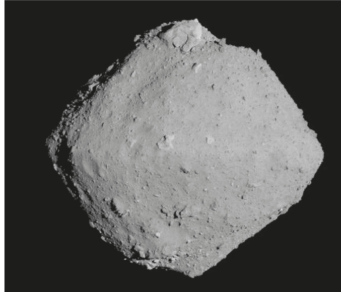
Abbildung 3: Der Asteroid Ryugu hat einen mittleren Durchmesser von 0.9 km und umläuft die Sonne in 473.9 Tagen einmal. Er zählt zu den sogenannten Apollo-Typen. Hier sehen wir eine Aufnahme der Sonde Hayabusa2.