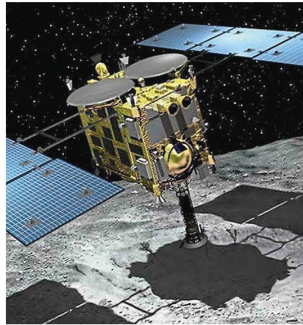
Abbildung 1: Künstlerische Darstellung der Raumsonde Hayabusa 2 bei der Probenentnahme.

orion Herr Busemann, Sie prüfen zurzeit die Proben vom Asteroiden Ryugu. Was können Sie, wenige Wochen nachdem Sie die Proben erhalten haben, bereits sagen?