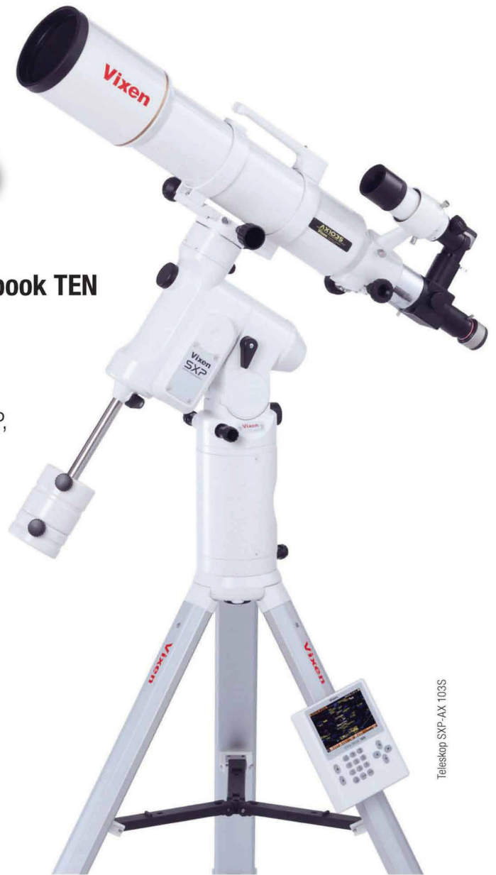
Teleskop SXP-AX 103S

VIXEN Fernrohr-Optiken: Achromatische Refraktoren – Apochromatische Refraktoren – Maksutov Cassegrain – Catadioptrische Systeme VISAC – Newton Reflektoren.