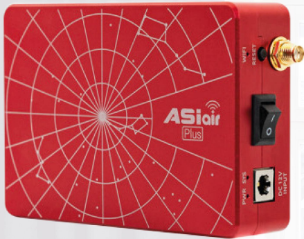
ZWO ASI AIR PLUS CHF 358.–

Besuche unseren neuen Astronomie-Showroom in Bern!