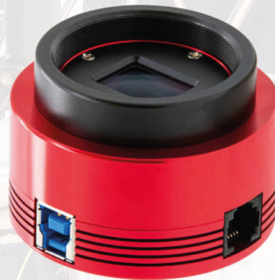
ZWO ASI 585MC CHF 398.–

Jetzt in unserem Online-Shop vorbeischaun und bestellen: foto-zumstein.ch