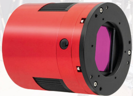
ZWO ASI 294MC-Pro CHF 1079.–