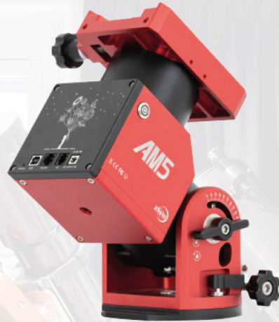
ZWO AM5 Mount CHF 2419.–