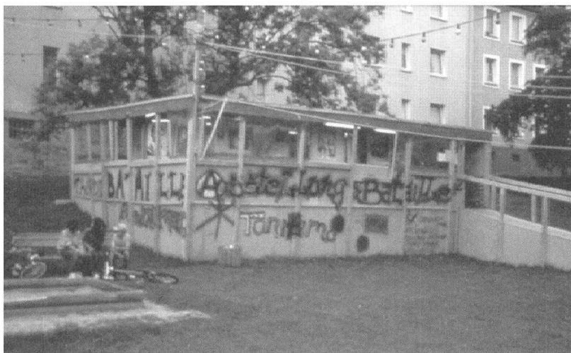
1 Thomas Hirschhorn, Bataille Monument , 2002, Documenta 11, Kassel

durchschnitt und hoher Arbeitslosigkeit, eine Reihe von favelaartigen Holzhütten aus einfachsten Materialien zusammen, die auf den Grünflächen der Wohnanlagen verteilt und durch eine Lichterkette miteinander verbunden waren. In den Hütten befanden sich eine gewerbliche Imbiss-Bude mit türkischen Speisen, eine dem Schriftsteller Georges Bataille (1897–1962) gewidmete Bibliothek, eine Ausstellung mit Schautafeln zu den Leitthemen des Schriftstellers und ein Newsroom für Vorführungen, Pressekontakte und anderes. Zwischen den Hütten fand sich auch ein in Klebefolie eingepacktes, amorphes Denkmal sowie eine Schautafel, die alle am Projekt mitwirkenden Personen aufführte; einfaches Material, Pinselhandschriften und Graffiti an den Aussenwänden kennzeichneten die gesamte Exposition. 4