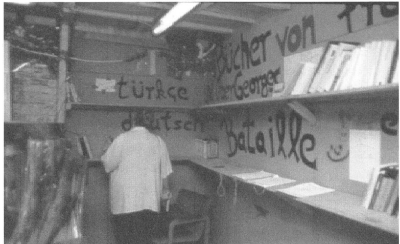
4 Thomas Hirschhorn, Bataille Monument , 2002, Documenta 11, Kassel