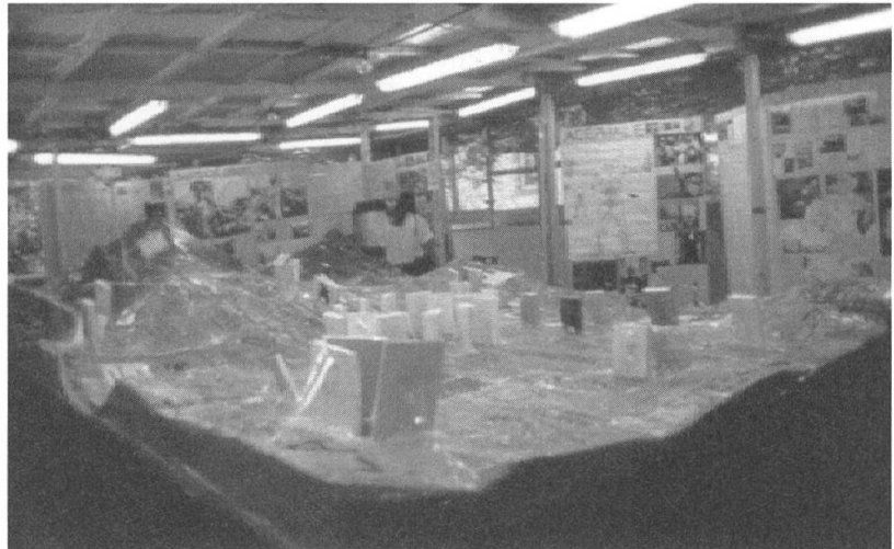
2 Thomas Hirschhorn, Bataille Monument , 2002, Documenta 11, Kassel

lichen und provisorischen Holzhütten solide ausnahm, war die Kontrastierung von Hütte und Wohnanlage riskant, da durch sie die Kasseler Nordstadt insgesamt zu einer Verfallszone erklärt wurde, in der die Wäscheständer und Bolzplätze plötzlich als Teil der Installation vereinnahmt wurden. Die Einrichtung einer zwar simpel gestalteten, aber hochkomplexen Bibliothek zu Ehren Batailles, dem erklärten Lieblingsautor des Künstlers, wirkte unvermittelt, da die Mehrzahl der AnwohnerInnen nach eigenem Bekunden mit der Person des französischen Schriftstellers wenig anzufangen wusste. Die Begehung der Anlage und seiner Grünflächen durch Gäste aus aller Welt, meist mit entsprechendem Einkommen und Bildungsstand, machte diese zu einer folkloristischen Vorführung von Eingeborenen.