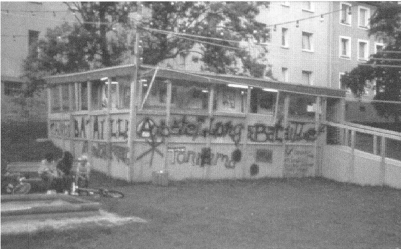
1 Thomas Hirschhorn, Bataille Monument , 2002, Documenta 11, Kassel

durchschnitt und hoher Arbeitslosigkeit, eine Reihe von favelaartigen Holzhütten aus einfachsten Materialien zusammen, die auf den Grünflächen der Wohnanlagen verteilt und durch eine Lichterkette miteinander verbunden waren. In den Hütten befanden sich eine gewerbliche Imbiss-Bude mit türkischen Speisen, eine dem Schriftsteller Georges Bataille (1897–1962) gewidmete Bibliothek, eine Ausstellung mit Schautafeln zu den Leitthemen des Schriftstellers und ein Newsroom für Vorführungen, Pressekontakte und anderes. Zwischen den Hütten fand sich auch ein in Klebefolie eingepacktes, amorphes Denkmal sowie eine Schautafel, die alle am Projekt mitwirkenden Personen aufführte; einfaches Material, Pinselhandschriften und Graffiti an den Aussenwänden kennzeichneten die gesamte Exposition. 4