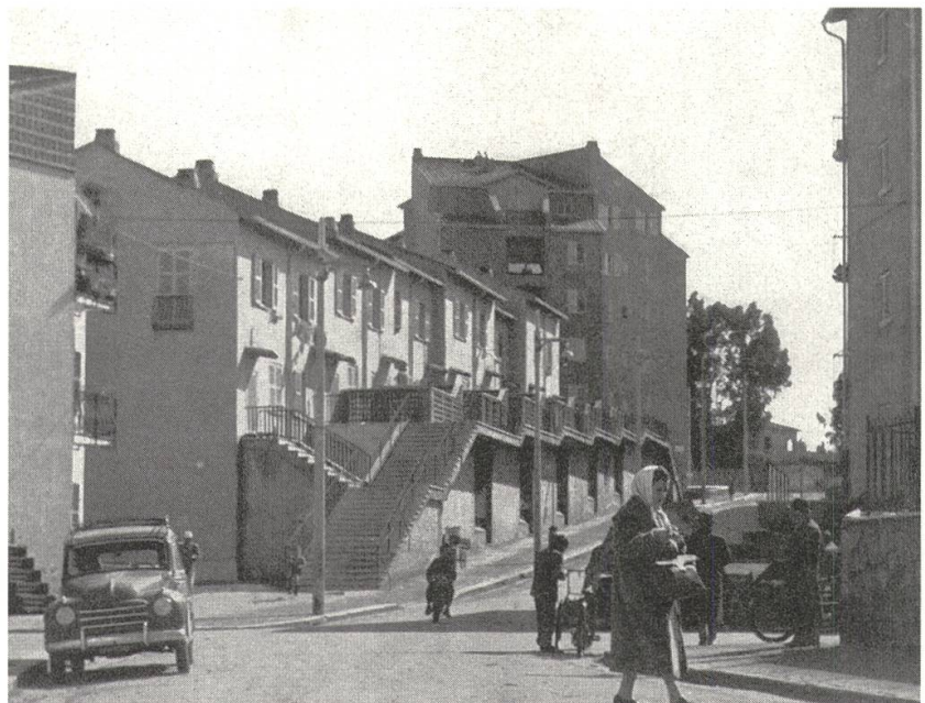
5 Quartiere Tiburtino, Rom

sind die dem letzten Obergeschoss vorbehaltenen heruntergezogenen Fenster, die nur in den ersten beiden Geschossen vorgesehenen Balkone, oder die Aussentreppe, die vom zweiten ins dritte Geschoss hinaufsteigen, um eine einzige Wohnung zu erschließen, rein architekturkompositorische Massnahmen, ausschliesslich szenografisch eingesetzt und der Wohnqualität der Häuser und der gesamten Siedlung eher abträglich (Abb. 4 und 5). Tatsächlich sollten die fehlenden Balkone kurz nach