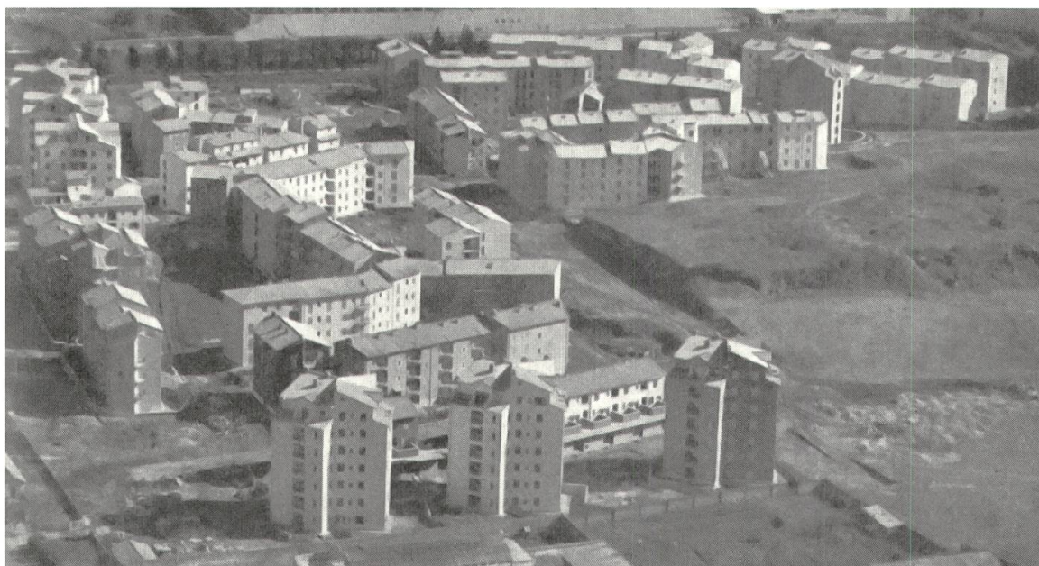
6 Quartiere Tiburtino, Rom, Luftbild