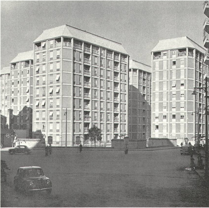
1 Mario Ridolfi, Case a torre am viale Etiopia, Rom, 1949–1956

Nicht minder benutzerfreundlich sind die Wohnungen verschiedener Größe, die in den Türmen als Drei- oder Vierspänner übereinandergestapelt und durch zentrale Treppenhäuser sowie Aufzüge erschlossen sind. Ihre kompakte und ökonomische Anordnung ermöglicht zwar keine natürliche Querlüftung, aber Zuschnitt und Ausstattung zeugen von einer ungewöhnlichen Aufmerksamkeit für die Lebensgewohnheiten der Bewohner. Auch die Fassaden, die durch die Tragstruktur aus Sichtbeton sowie die Füllelemente aus verputztem Mauerwerk, aus Fensterteilen und (bei den Treppenhäusern) aus Glasbausteinen respektive durch die Hohlräume der Loggien geprägt werden, sind bei allen Rationali-