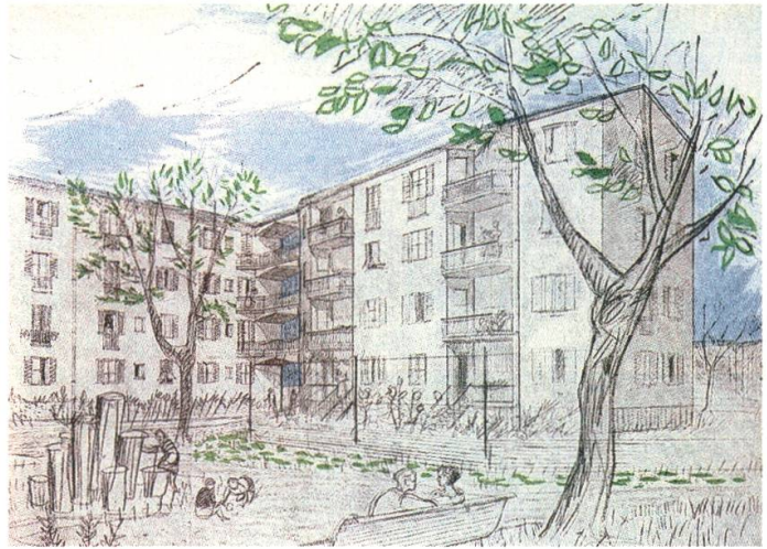
3 Ludovico Quaroni, Mario Ridolfi u. a., Quartiere Tiburtino, Rom, 1950–1954, Perspektive

Traditionelle, arbeitsintensive Konstruktionstechniken wurden bewusst angewandt, und ebenso bewusst wurden sie weitestgehend vereinheitlicht, um möglichst