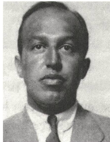
2 Clement Greenberg, 1939