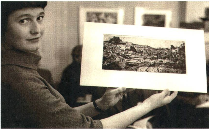
4 Die Radierung von Hercules Seghers, die 1958 einen Rekordzuschlag von 122 000 Franken erreichte

Werk darstellte. Einen weiteren Höchstpreis erbrachte 1959 Noldes schönes Gemälde Christus und die Sünderin von 1926. Das Bild war einst im Besitz der Nationalgalerie Berlin, wurde 1937 im Rahmen der Aktion «Entartete Kunst» beschlagnahmt, danach in der gleichnamigen Propagandaausstellung gezeigt und 1939 bei Fischer in Luzern für 1800 Franken an einen Berner Sammler verkauft. 37 Von dort gelangte es 1959 zu Kornfeld, wo es weit über die Schätzung auf 122 000 Franken gehoben wurde. Das Werk gelangte