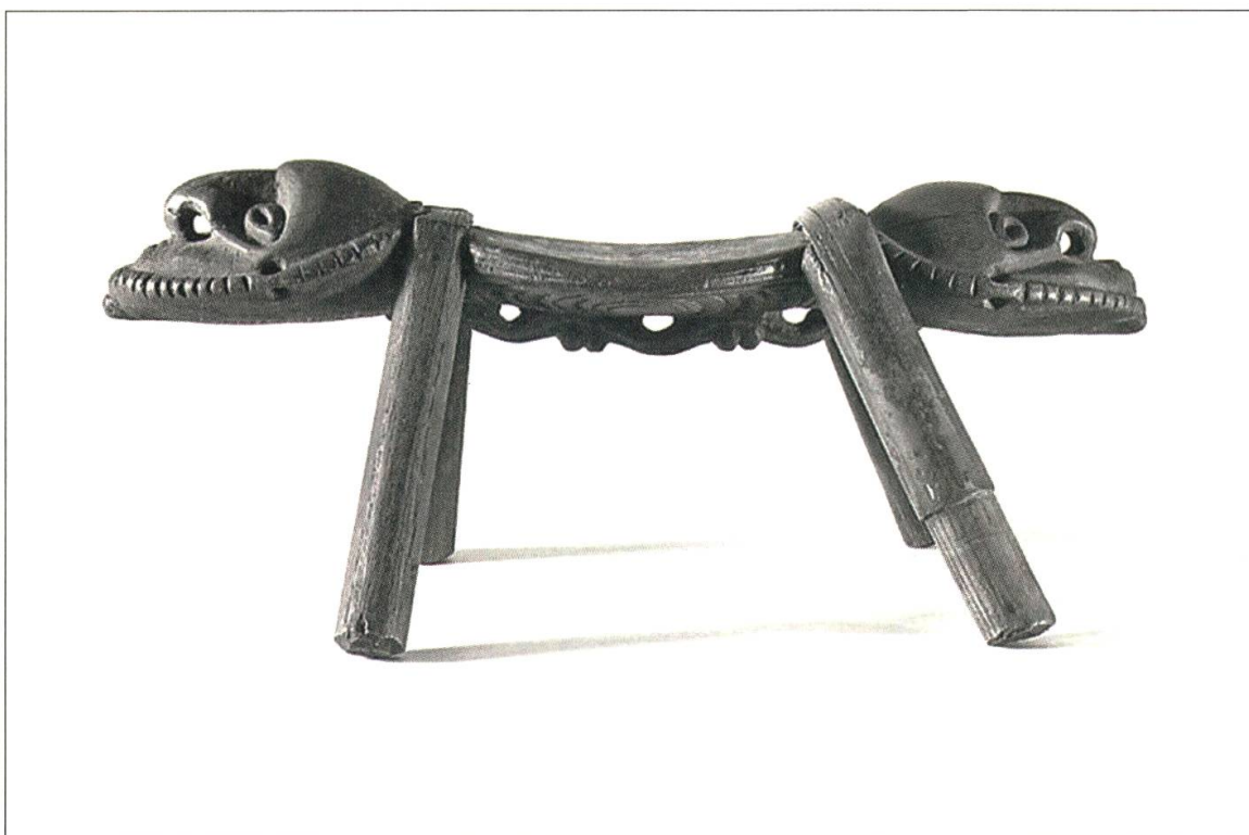
1 Kopfbank, Neu-Guinea, Sepik, 19./frühes 20. Jh., Holz, 12 x 33 cm, Museum Rietberg Zürich

Verkaufsausstellungen bezeichnet werden können. Die definitive Auflösung der Sammlung erfolgte 1954 durch eine Auktion beim Stuttgarter Kunstkabinett. 5 Gerne hätte sie ihre Sammlung integral einem Schweizer Museum vermacht gehabt, dies kam jedoch vor allem aufgrund der Verslossenheit gegenüber dieser Kunstgattung der Schweizer Museumswelt bzw. des Schweizer Kunstmarktes damals nicht zustande.