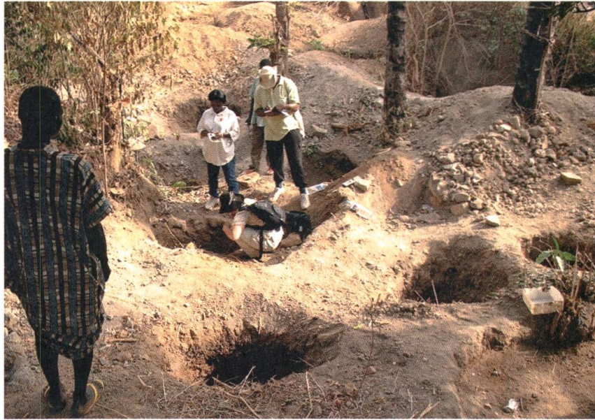
2 Près de Nok (Nigeria), les archéologues découvrent la destruction d'un site archéologique par les villageois à la recherche de statuettes en terre cuite, 2009

lectionneur pour plus de 100 000 francs, qui enfin le liquidera en vente publique, une fois valorisé par des expositions et des publications luxueuses, pour 1 000 000 de francs. Les sommes en jeu autorisent toutes les stratégies de corruption ou de substitution d'œuvres. La démarche est bien connue: sortie illégale de l'objet du pays, établissement d'un «pedigree» (pseudo-autorisation d'exportation, inventaire de succession, certificat de vente, etc.) et blanchiment dans un pays laxiste, par une exposition et un catalogue, si possible cautionné par un professionnel, avant la mise en vente.