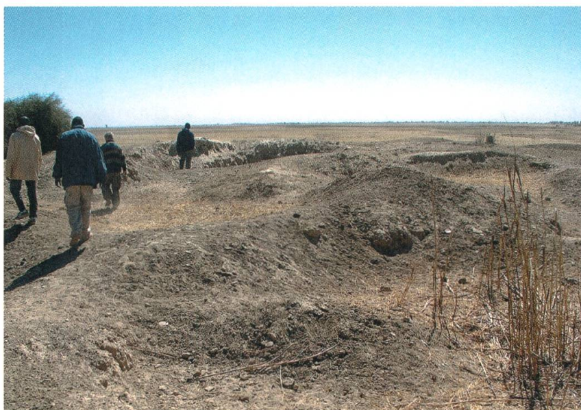
1 Sur les rives du Niger (Mali), site d'habitat détruit par les pillleurs à la recherche d'objets archéologiques, 2008