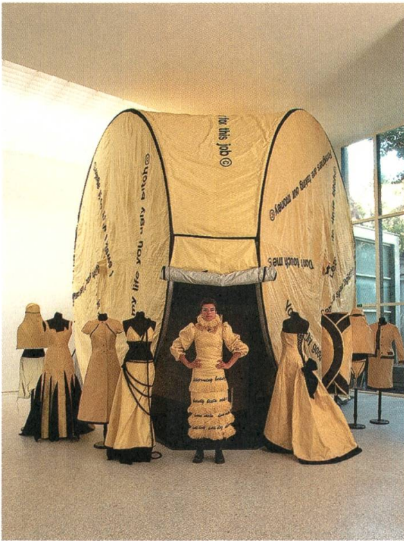
5 Alicia Framis (* 1967), anti_dog Project , 2003, Multimedia-Arbeit für den holländischen Beitrag «We Are The World», 50. Biennale von Venedig, 2003

Künstler mit nicht-europäischem Hintergrund – Carlos Amorales aus Mexiko (Abb. 5) und Meschac Gaba aus Benin – ausgewählt, die in Amsterdam studiert hätten und/oder dort lebten. 57