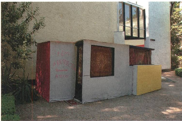
4 Erik van Lieshout (* 1968), Respect , 2003, Videoinstallation für den holländischen Beitrag «We Are The World», 50. Biennale von Venedig, 2003, im Hintergrund der holländische Pavillon