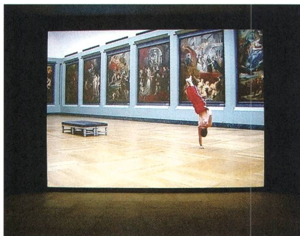
9 Shahryar Nashat (* 1975), The Regulating Line , 2005, Digital Video, 3'40", Ansicht der Projektion im Rahmen des Schweizer Beitrags «Shadows Collide With People», 51. Biennale von Venedig, 2005

betrachtet der junge Mann die Werke des Meisters (Abb. 8), bevor er den Versuch unternimmt, einen Handstand auszuführen und dann in dieser Stellung auf einer Hand zu balancieren (Abb. 9). Anders als frühere Arbeiten des Künstlers verweigert sich das Werk der gesprochenen Sprache. Im Zentrum steht der menschliche Körper, in dem widersprüchliche Konzepte aufeinander treffen: Kunst und Sport, Weiblichkeit und Männlichkeit, Monumentalität und Minimalismus.