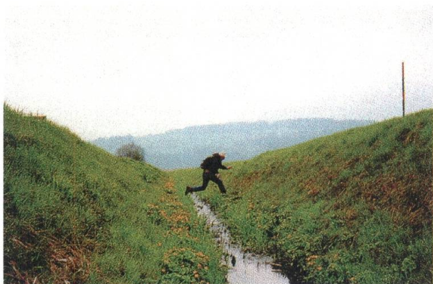
2 Christian Philipp Müller (* 1957), Grüne Grenze , Österreichs Beitrag zur 45. Biennale von Venedig, 1993 (am Hasenbach, an der grünen Grenze zwischen Österreich und dem Fürstentum Liechtenstein)