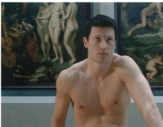
8 Shahryar Nashat (* 1975), Still aus The Regulating Line , 2005, Digital Video, 3'40", Arbeit für den Schweizer Beitrag «Shadows Collide With People», 51. Biennale von Venedig, 2005