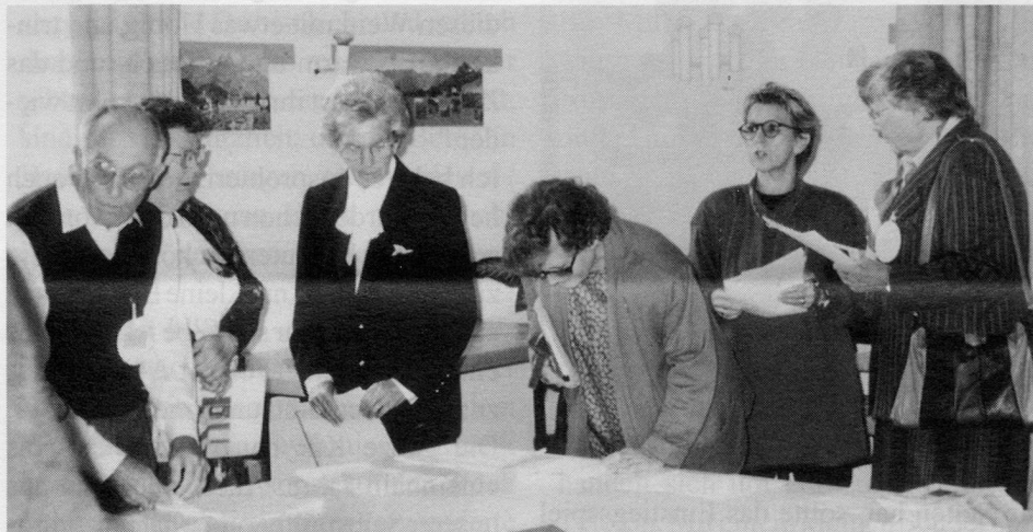
Wichtige Informationen für Gruppenleiterinnen und -leiter: Welche Möglichkeiten gibt es, um mit der Gruppe zu reisen, welche Transportmittel stehen zur Verfügung, wo gibt es Vergünstigungen, welche Restaurants sind für die Gruppe geeignet? Zu diesen Fragen standen hilfreiche