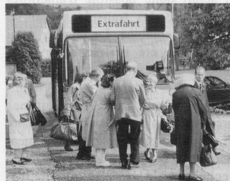
Ankunft in Wislikofen mit dem Extrabus