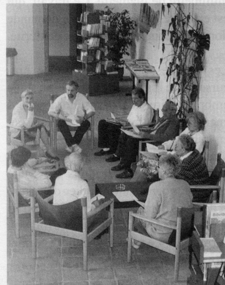
In den Gruppen kamen sich die Teilnehmer näher und fühlten sich bald wie in einer grossen Familie