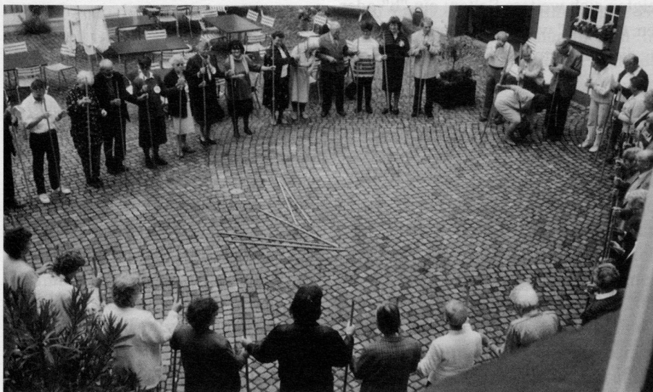
Ein Kreis im Hof: Im Rhythmus des Stabtanzes wird Geben und Nehmen erlebbar