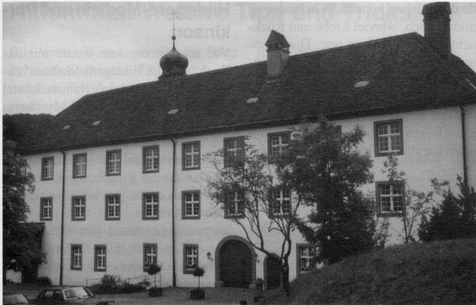
Die Propstei Wislikofen erwies sich als idealer Tagungsort