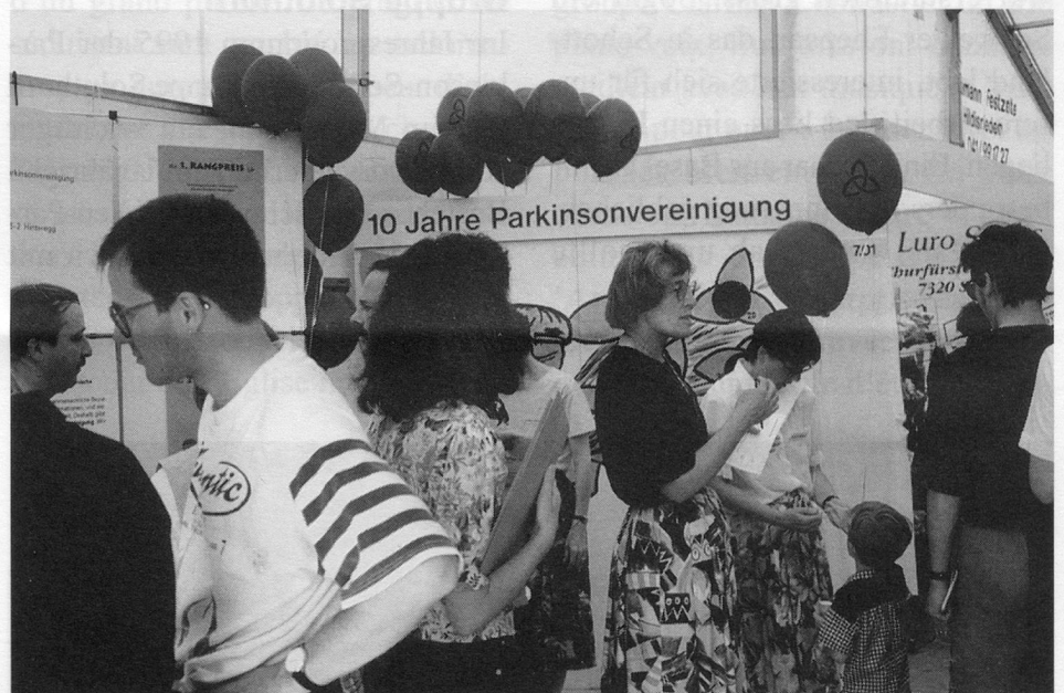
Gross war das Publikumsinteresse: für die Informationen sorgten viele Helferinnen und Helfer.

in Bern konnten wir mit grosser Freude und Stolz einen Check über Fr. 8000.— überreichen. Herzlichen Dank an alle, die zu diesem tollen Ergebnis beigetragen haben!