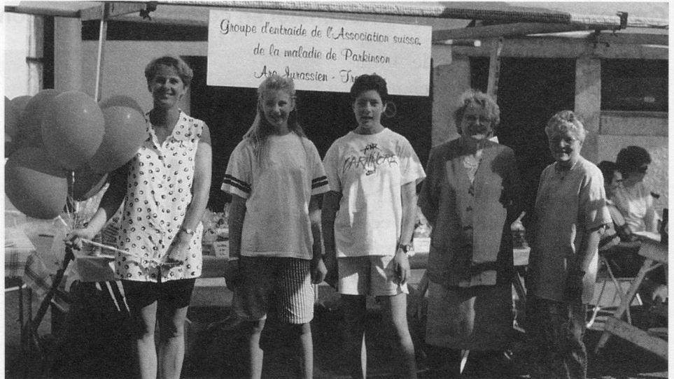
Les vendeuses à la Foire de Tramelan.

Puis les années ont filé Et me voilà un peu ridée Bientôt ce fut une autre vie