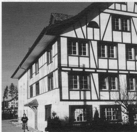
Le siège du secrétariat central à Hinteregg

geant plus particulièrement d'organiser les journées d'information et de rechercher les conférenciers. Nous pensons notamment que la présence des malades et de leurs familles à ces journées est indispensable, afin qu'ils puissent témoigner et faire part de leurs souhaits.