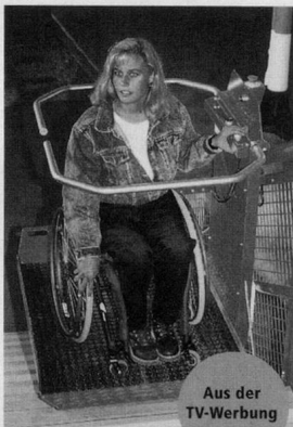
Aus der TV-Werbung