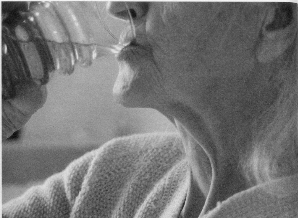
Mangiare e bere separatamente previene i problemi d'deglutizione

Se i disturbi sono troppo gravi , si può usare una sonda gastrica. Non si tratta di sostituire la normale nutrizione per via orale, ma di completarla. «Molti hanno dei preconcetti contro la