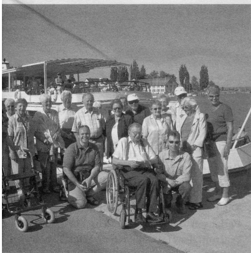
...pe mit ihren jungen Betreuern vor ihrer Schiffsreise.

Regionaltagung in Wil Zum ersten Mal konnten wir das Leitungsteam der JUPP Säntis begrüßen. Alle haben sich über diesen jungen Zuwachs gefreut! «Neueintritte bringen andere Gedanken und frischen Wind», so die Teilnehmenden. Es