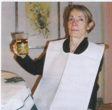
Rita Ryffels Servietten: Praktischer und umfassender Schutz.

Ab CHF 30.- pro Stück, zzgl. CHF 4.- Versandkosten, Rita Ryffel, Stettbachstr. 40, 8600 Dübendorf, Tel. 044 822 17 90, E-Mail: r.ryffel@glattnet.ch