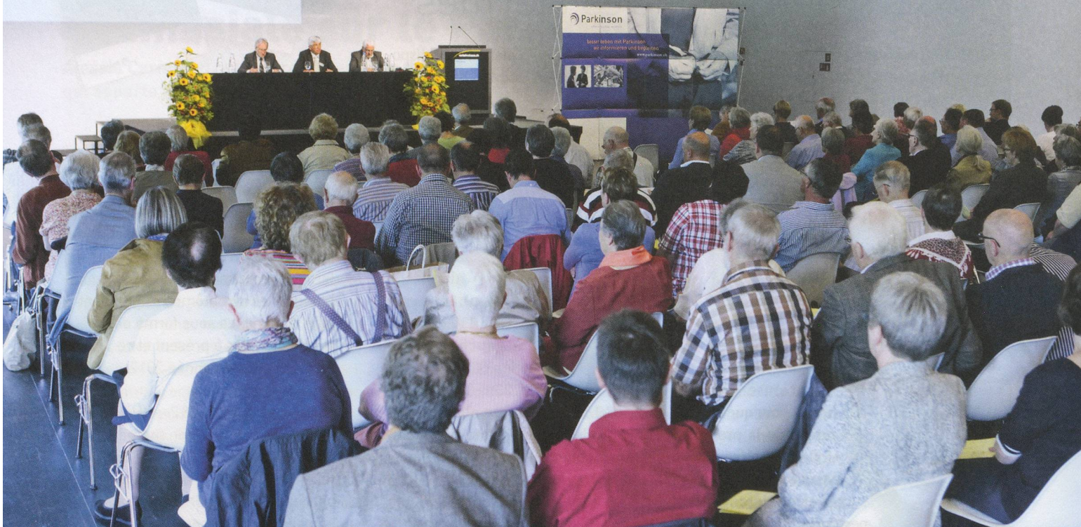
Une salle de réunion bien remplie : 107 membres et 29 invités se sont rendus à Lucerne pour assister à l'assemblée générale.