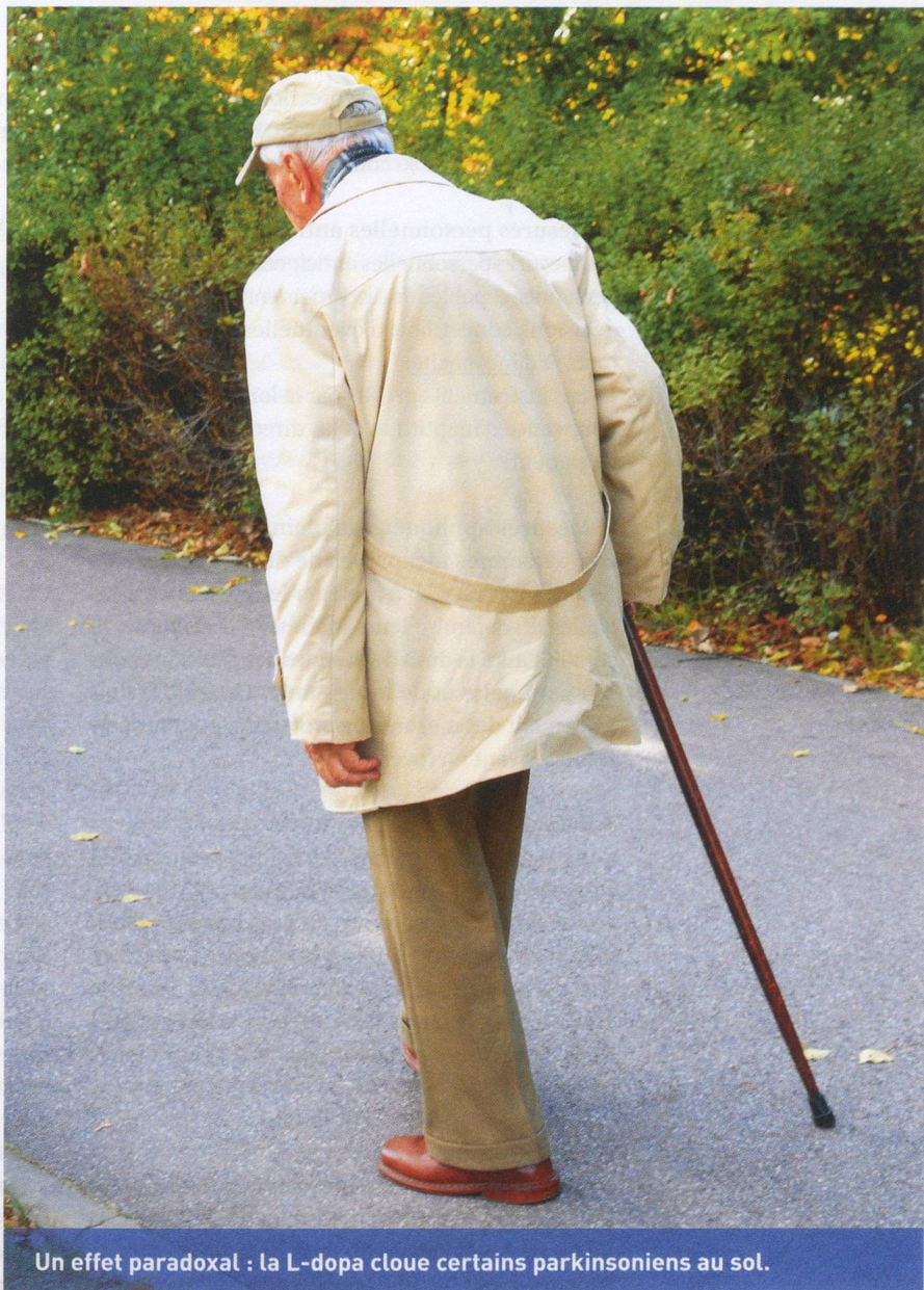
Un effet paradoxal : la L-dopa cloue certains parkinsoniens au sol.