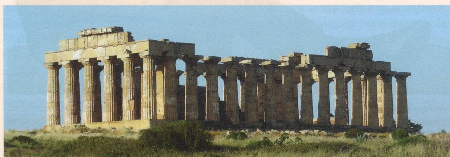
Durante il viaggio culturale nella Sicilia occidentale ci sarà molto da scoprire.