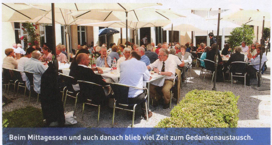
Beim Mittagessen und auch danach blieb viel Zeit zum Gedankenaustausch.

Natürlich deckt dieses Gesetz auch nicht medikamentöse Forschung ab, also etwa Studien zur Gedächtnisleistung bei Parkinson, wie sie Prof. Fuhr in Basel durchführt. Diese Art der Forschung hat natürlich deutlich kleinere Risiken als die medikamentöse Forschung und kann sogar regelrecht Spass machen, wie ein Patient, der an einer Basler Studie zur kognitiven Leistung bei Parkinson teilnahm, bestätigte: «Ich fuhr gerne mehrmals aus der Ostschweiz nach Basel, denn die Studie und die dabei zu