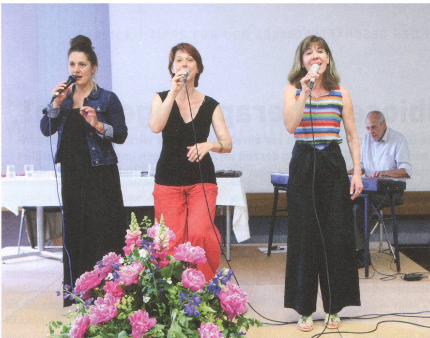
Das Basler Ensemble «The Ladybirds» sorgte für musikalische Unterhaltung.