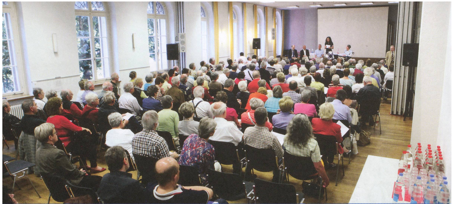
Sehr interessant: Beim Parkinsonforum erläuterten Experten, was bei der Teilnahme an Forschungsstudien zu beachten ist.