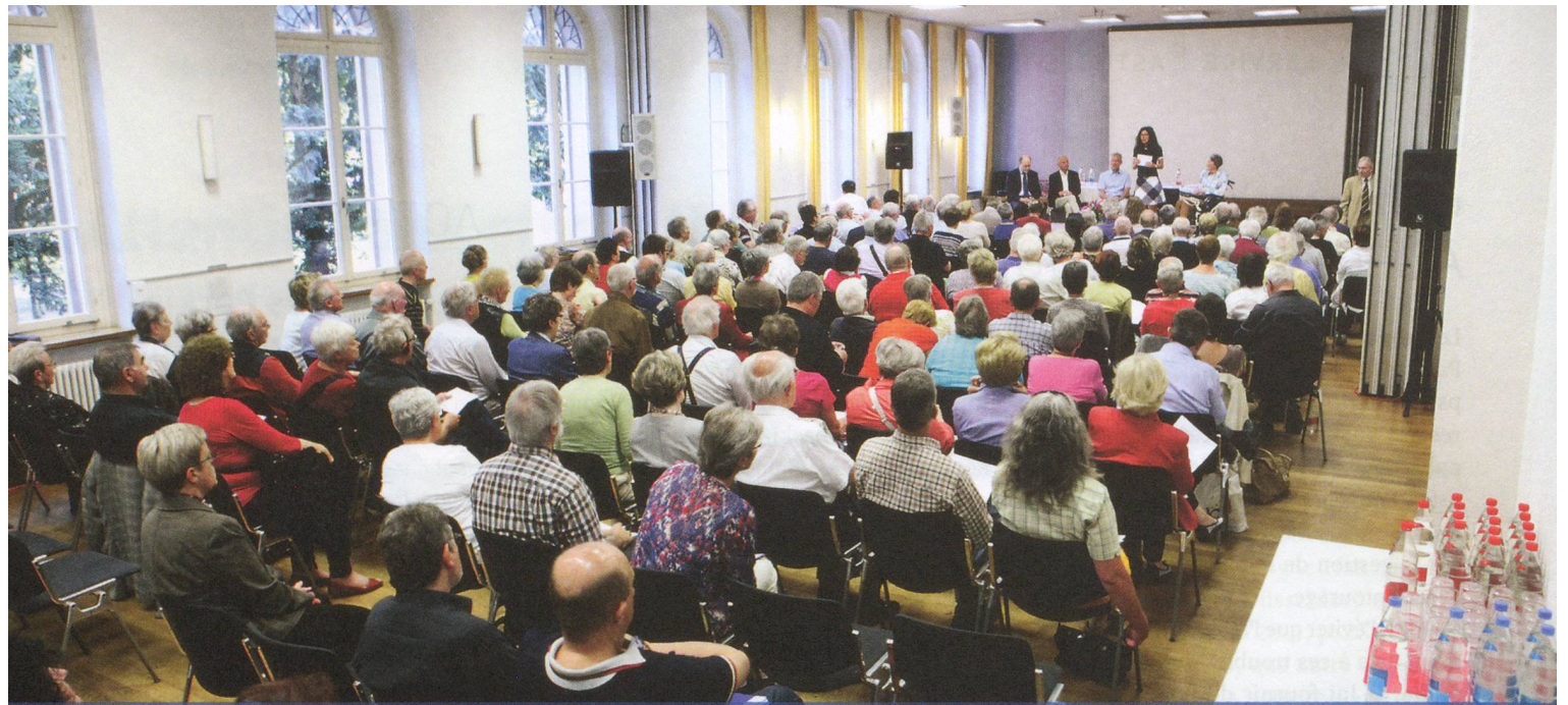
Forum Parkinson : les experts ont expliqué ce à quoi il convient de prêter attention en cas de participation à des études cliniques.