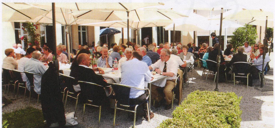
Pendant et après le repas de midi, les échanges sont allés bon train.

Bien entendu, cette loi couvre également la recherche non médicamenteuse, c'est-à-dire par exemple les études sur les capacités de mémoire en cas de Parkinson, spécialité du Prof. Fuhr à Bâle. Ce type de recherche présente naturellement des risques plus faibles que la recherche médicamenteuse. Elle peut même être source d'un réel plaisir, comme le confirme un patient qui a participé à une étude sur les performances cognitives en cas de Parkinson : « J'habite la Suisse orientale et je me suis