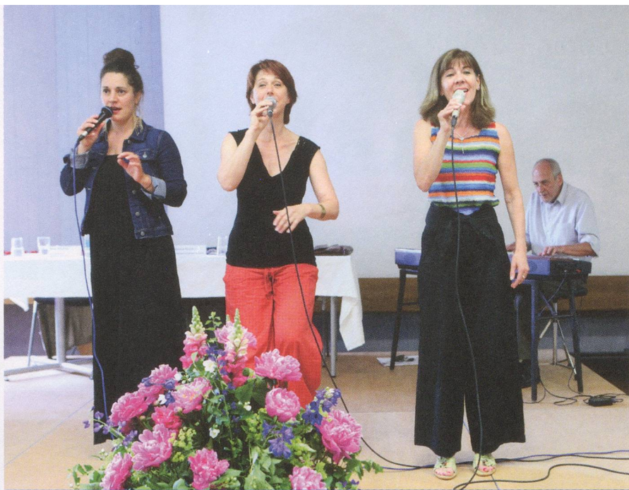
L'ensemble bâlois « The Ladybirds » a assuré l'animation musicale.