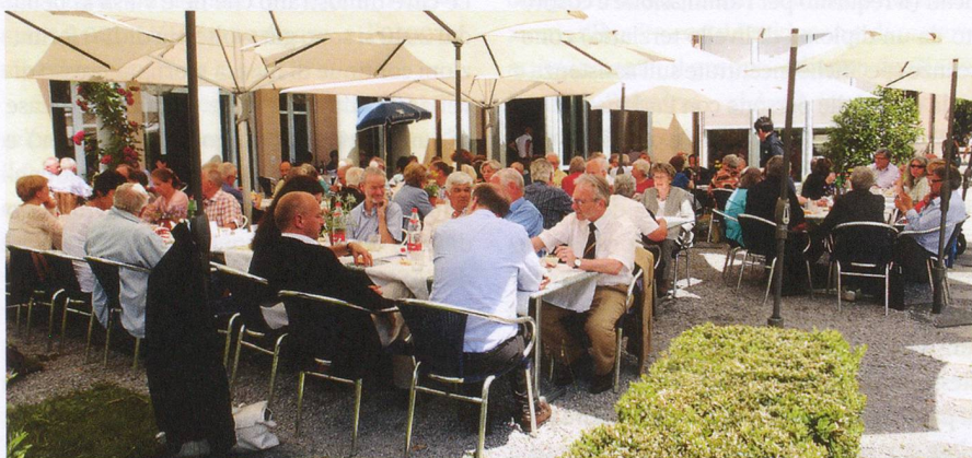
Durante e dopo il pranzo, molto tempo è stato dedicato allo scambio di opinioni.