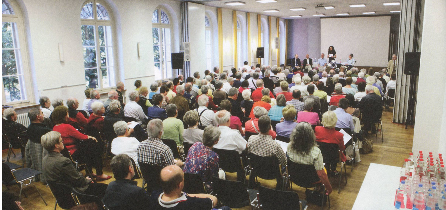
Durante il «Parkinson-Forum», gli esperti affrontano il coinvolgente tema della partecipazione a progetti di ricerca.