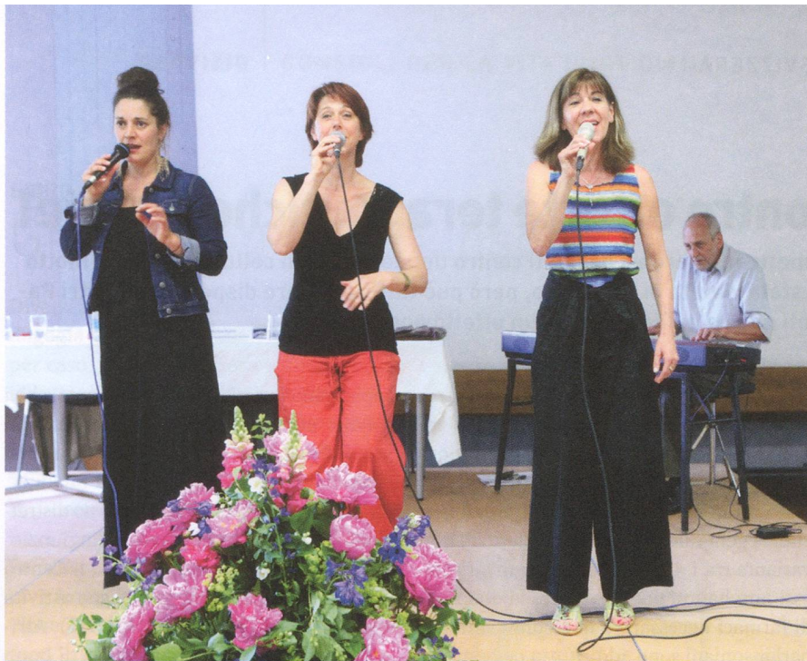
Il gruppo basilese delle Ladybirds ha assicurato l'intrattenimento musicale.