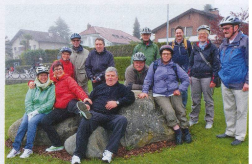
Trotzten beim Maibummel der Kälte: Die «Mutigen» der SHG JUPP Säntis.