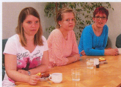
Lehrreich: Drei Logopädiestudentinnen waren zu Besuch bei der SHG Frauenfeld.

Am 8. Juni luden die Lions Clubs Stäfa und Forch die SHG Rechtes Zürichseeufer und Zürcher Oberland wieder zum Sommerausflug – es war das 15. Mal! Natürlich hatten sich die Organisatoren auch dieses Jahr wieder etwas Grossartiges ausgedacht, um den Gästen ein schönes Fest zu bieten: einen Ausflug in die Gärtnerei van Oordt, oberhalb von Stäfa gelegen, mit gemeinsamem Mittagessen und Livemusik. Und natürlich konnten die Gäste auch die interessante Ausstellung der Gärtnerei besuchen. Es war wiederum für alle ein schöner Anlass und die Gruppen danken den Lions Clubs für die Einladung und die wahrlich perfekte Organisation. Anna Eijsten