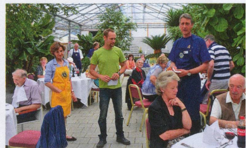
Grüner Tag: Die Lions Clubs Forch und Stäfa luden zum Feiern in die Gärtnerei.