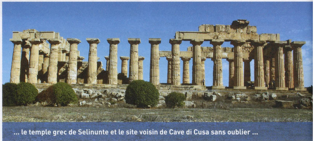
... le temple grec de Selinunte et le site voisin de Cave di Cusa sans oublier ...