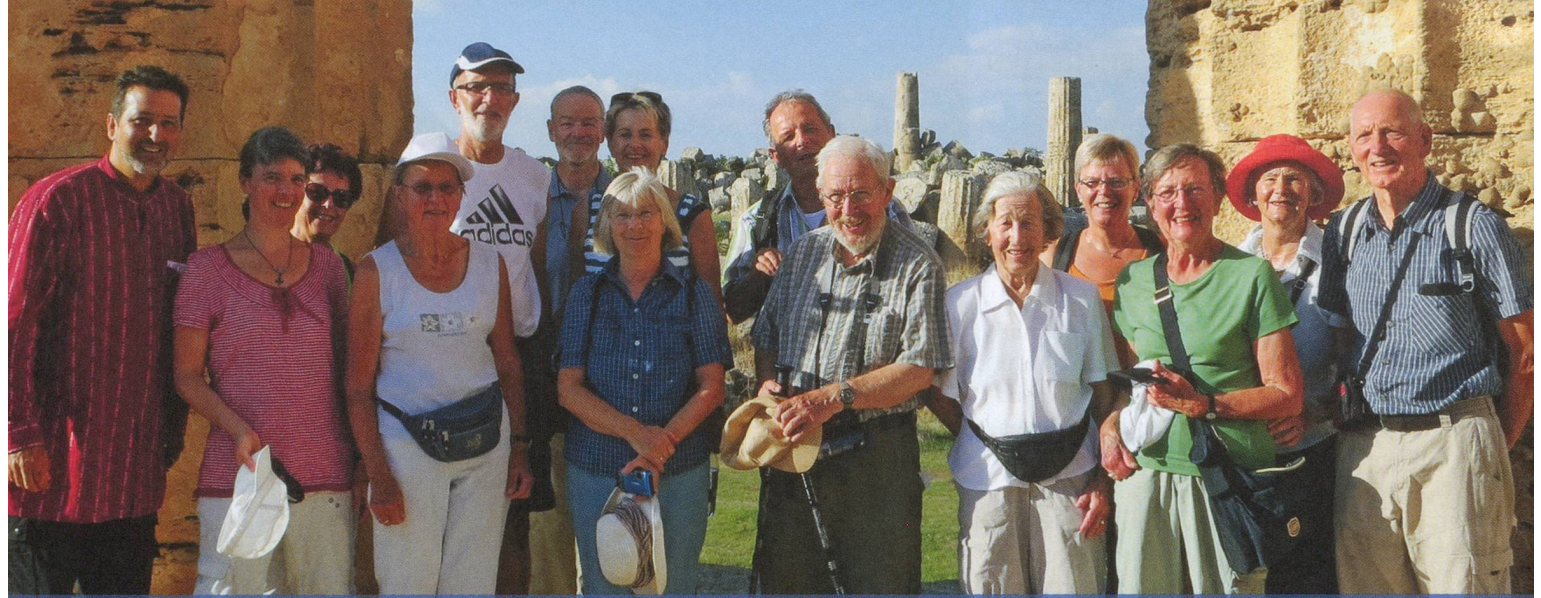
Une troupe joviale à la découverte de la Sicile : les participants au 2 e voyage culturel Parkinson ont notamment visité...