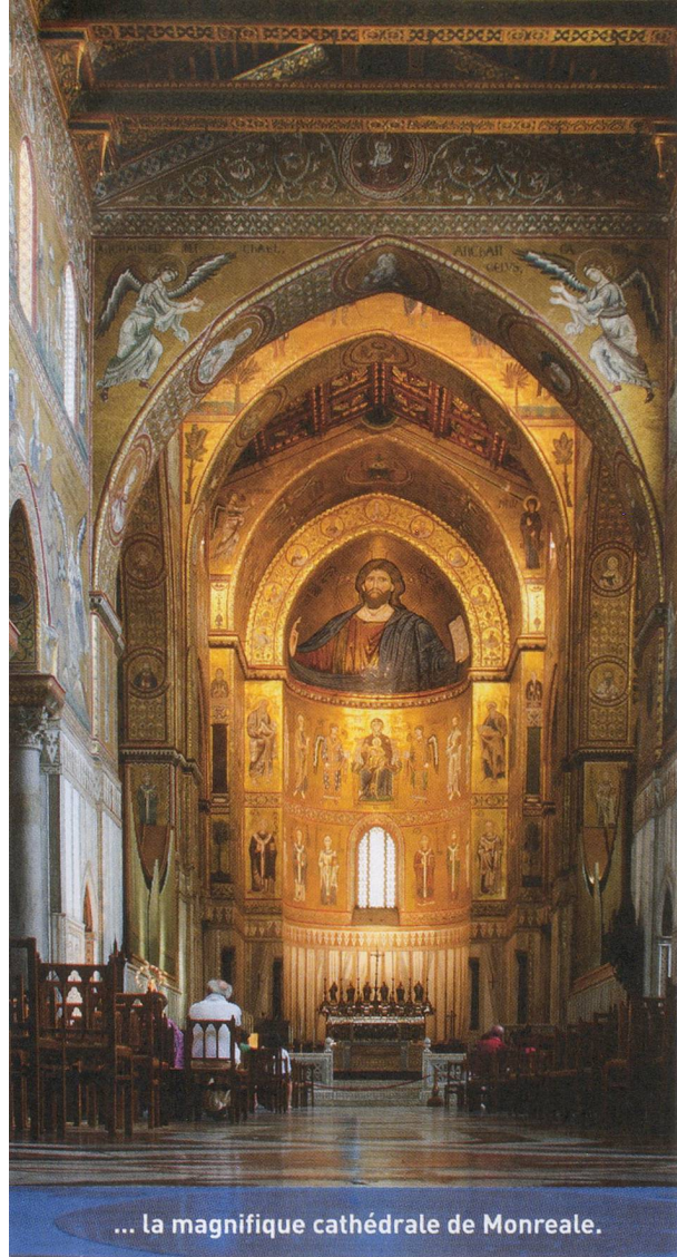
... la magnifique cathédrale de Monreale.

passer à côté du subtil pavement d'inspiration islamique semblable à un tapis de pierre.