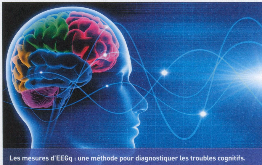
Les mesures d'EEGq : une méthode pour diagnostiquer les troubles cognitifs.