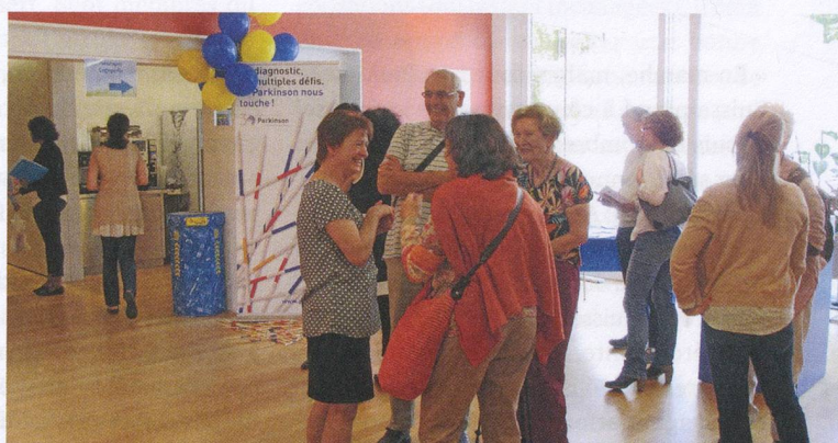
À Lausanne, l'association était présente lors de la journée portes ouvertes du Site de Plein Soleil organisée le 22 mai.