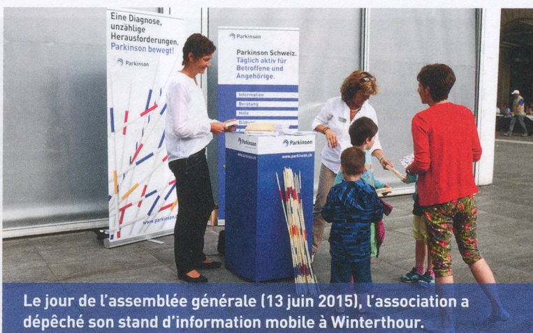
Le jour de l'assemblée générale (13 juin 2015), l'association a dépêché son stand d'information mobile à Winterthur.