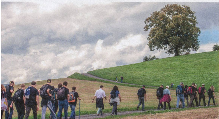
Beim «Walk & Talk» fand ein intensiver krankheitsübergreifender Austausch statt – draussen statt im Saal!