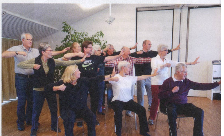
Die Teilnehmerinnen und Teilnehmer des Qigong-Seminars wollen, dass 2016 wieder ein Kurs stattfindet.