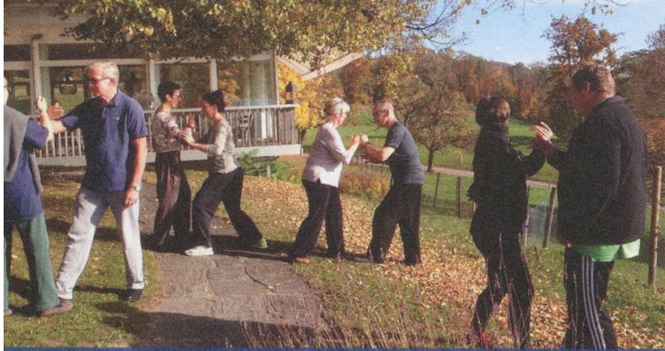
Tai-Chi-Seminar: Die chinesische Kampfkunst fördert das Gleichgewicht und die Gangsicherheit.