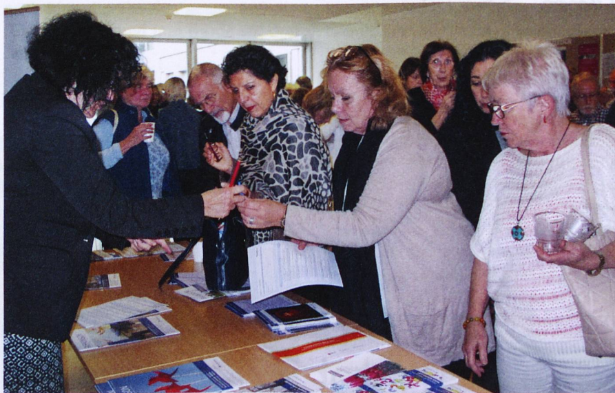
Les participants ont manifesté un grand intérêt pour la documentation pendant la pause.