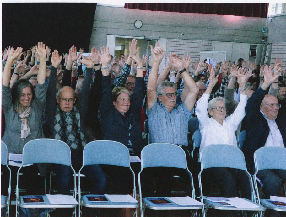
In Bewegung bleiben – am besten gemeinsam: Betroffene an der Informationstagung in Zihlschlacht 2016.