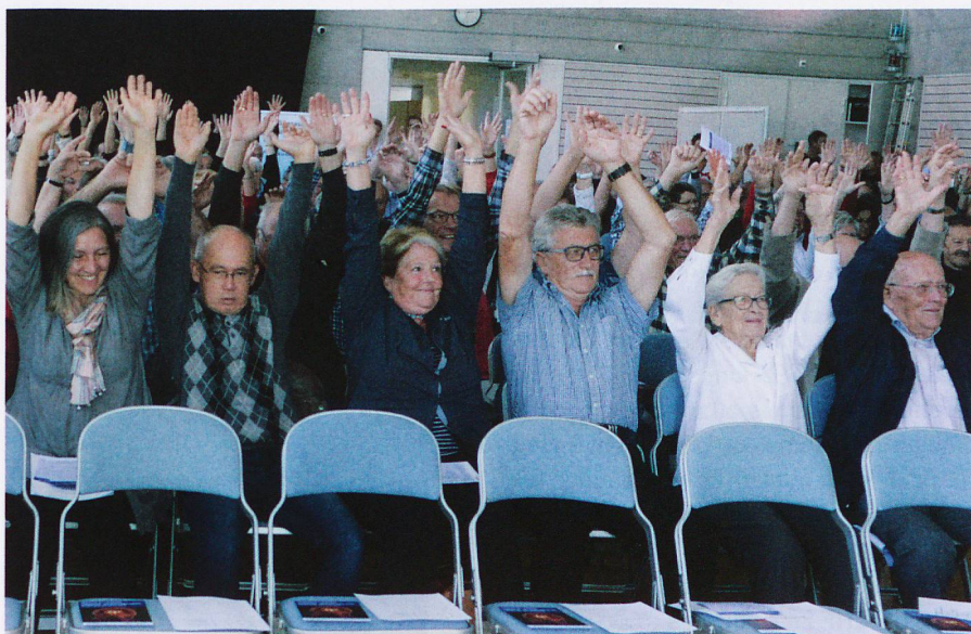
Rester en mouvement, et de préférence ensemble : les participants à la séance d'information de Zihlschlacht en 2016.