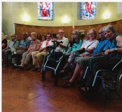
SHG Bern in der Kirche Belp.