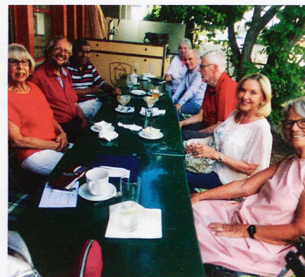
Weiterbildungsanlass der SHG Zürich.