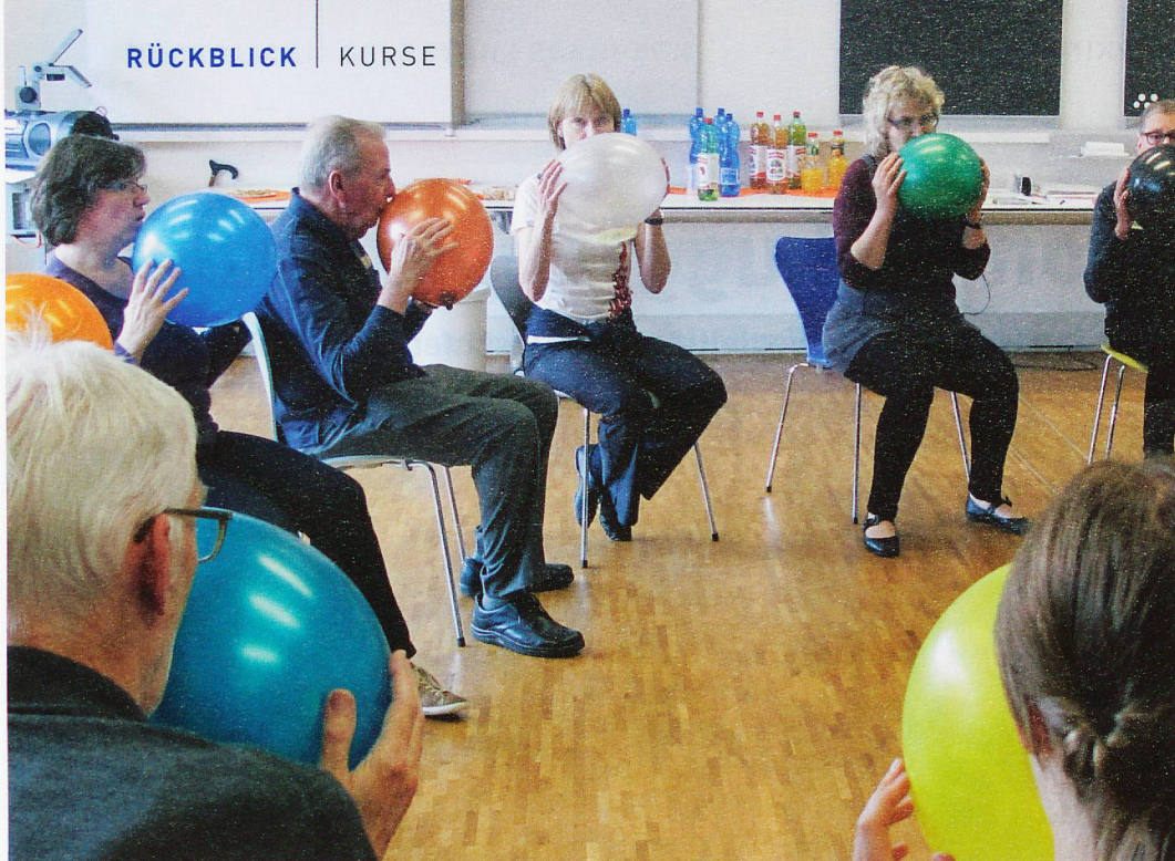
Gemeinsam üben macht mehr Spass: Stimmtraining mit Luftballons.