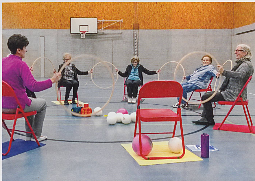
Fare ginnastica insieme fa piacere e mantiene il fisico.